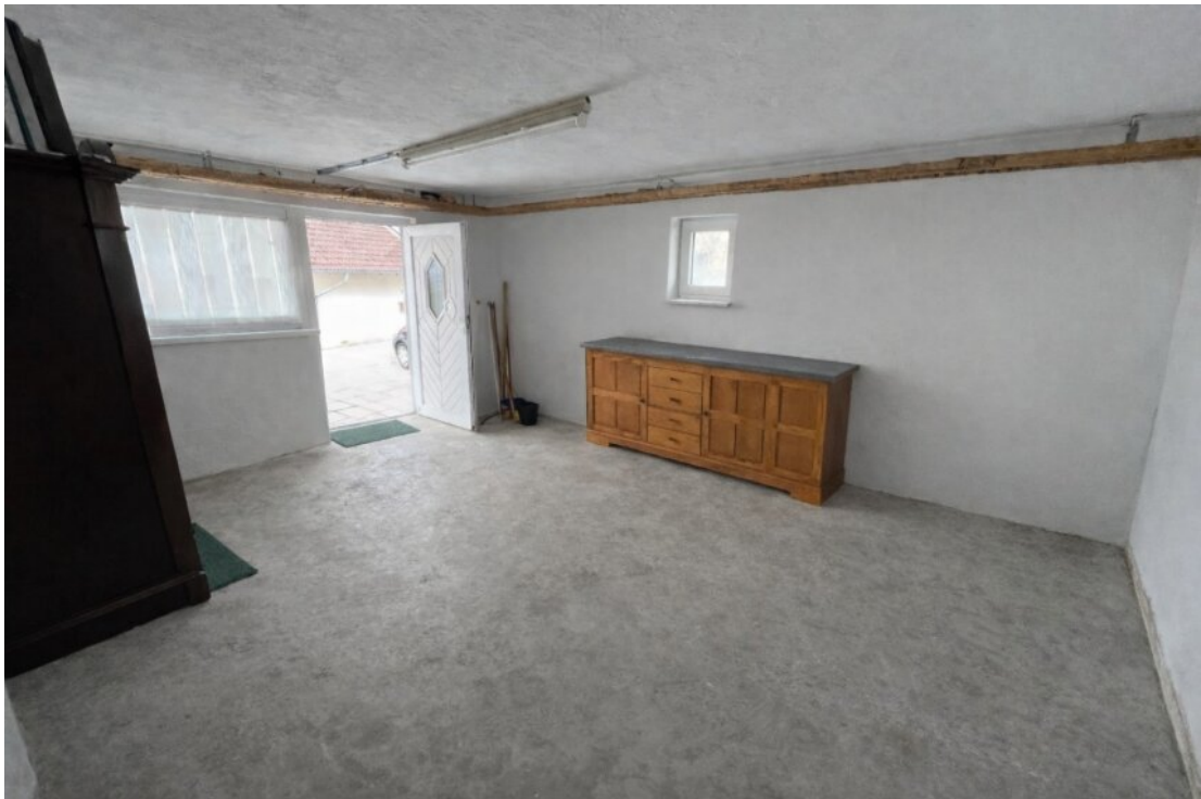
UG Werkstatt, ehemals Garage