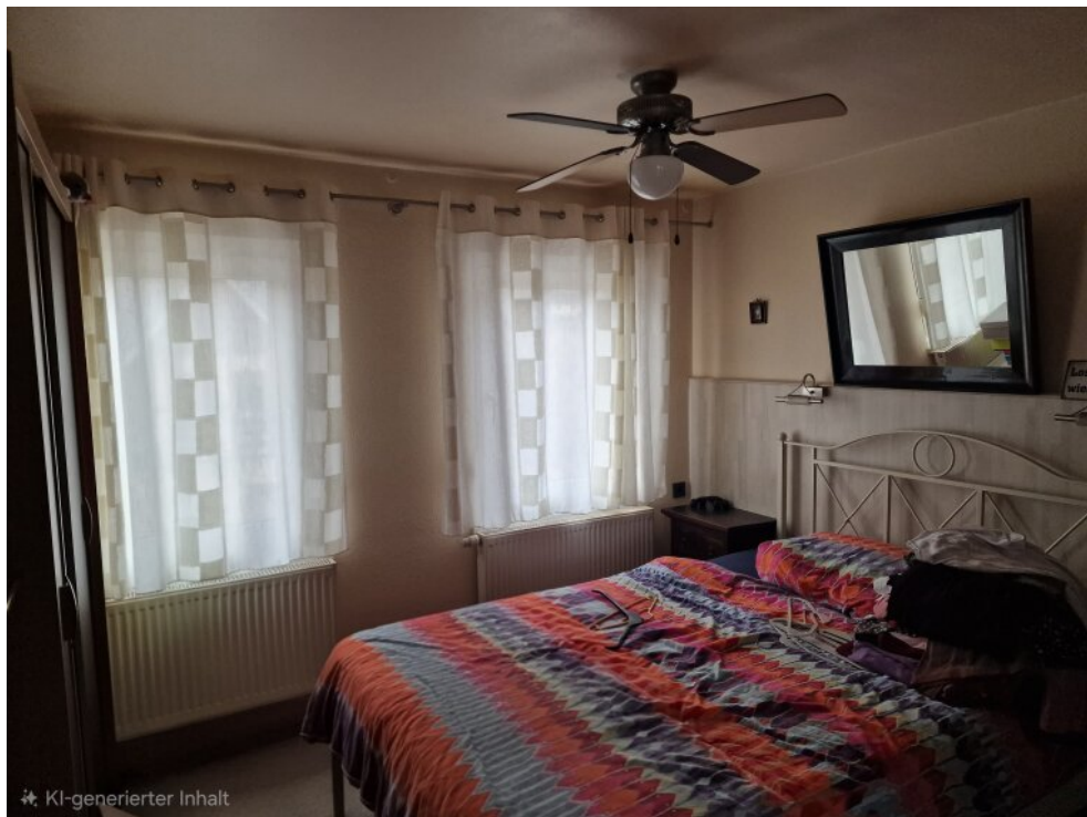
Zimmer Haus 1