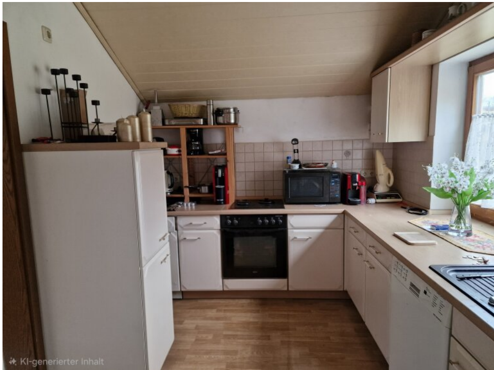
Küche Haus 2