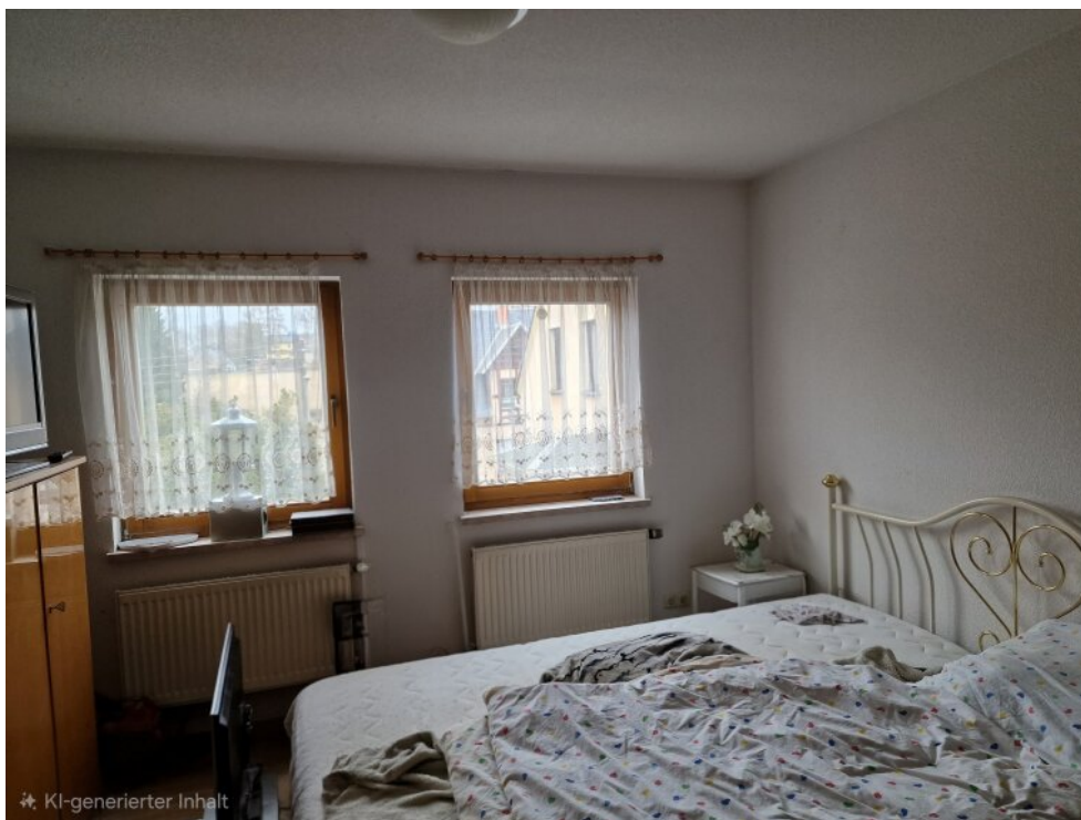
Schlafzimmer Haus 2