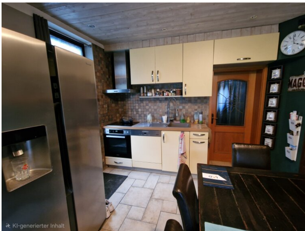
Küche Haus 1