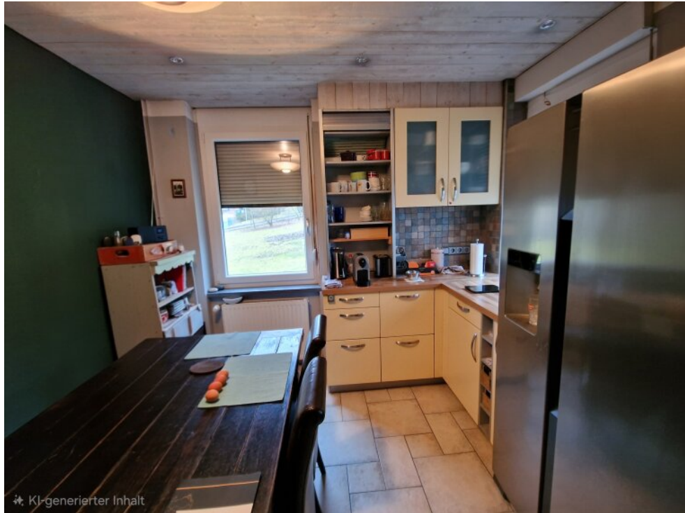
Küche Haus 1