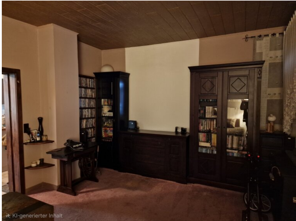
Wohnzimmer Haus 1