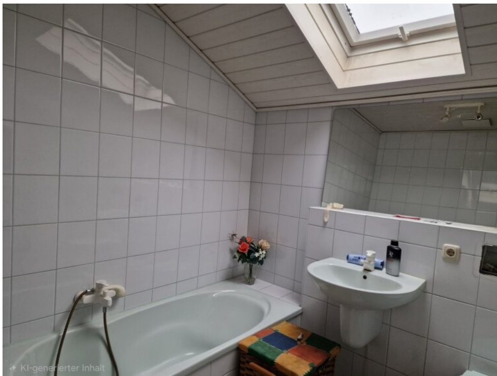
Bad Haus 2