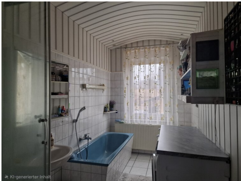
Bad Haus 1