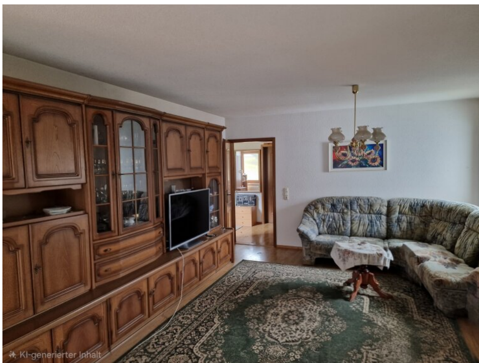
Wohnzimmer Haus 2