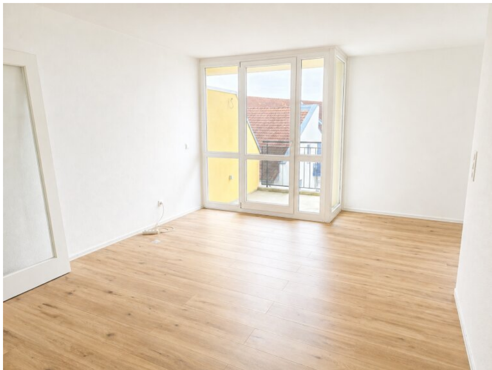
2 .OG Raum mit Balkon