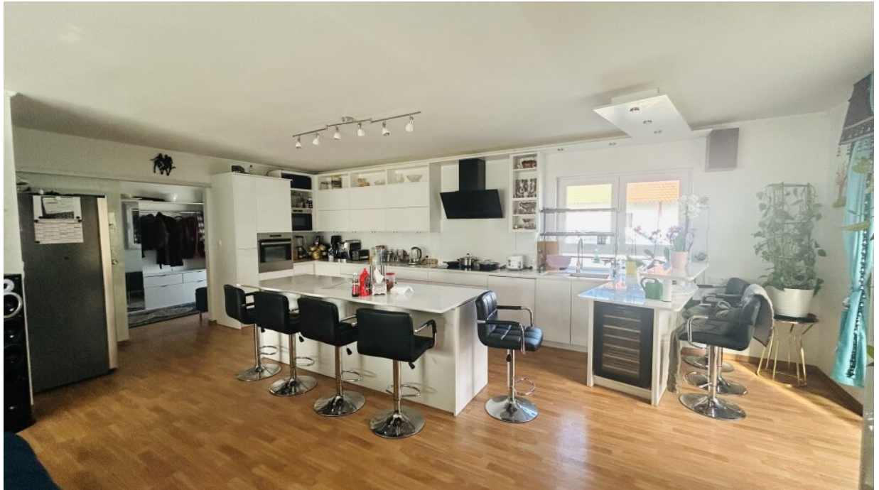
Küche und Wohnzimmer