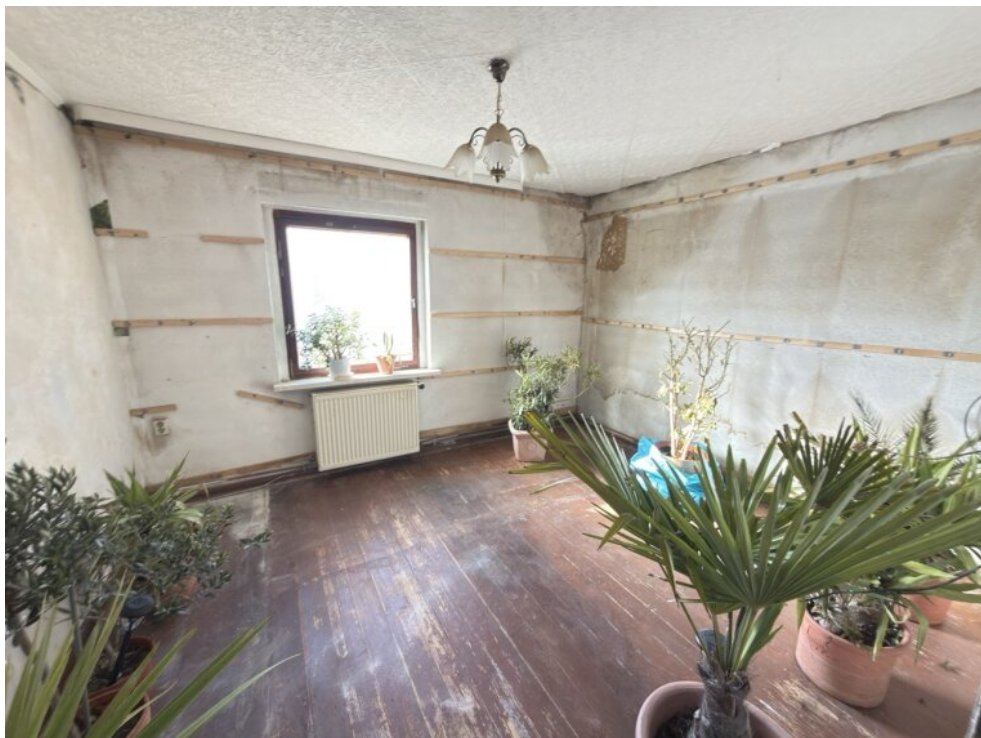
Zimmer (2) EG