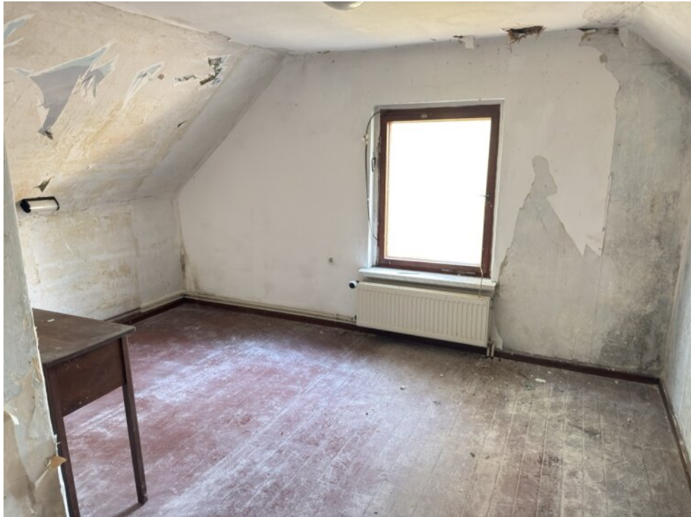
Zimmer (5) OG