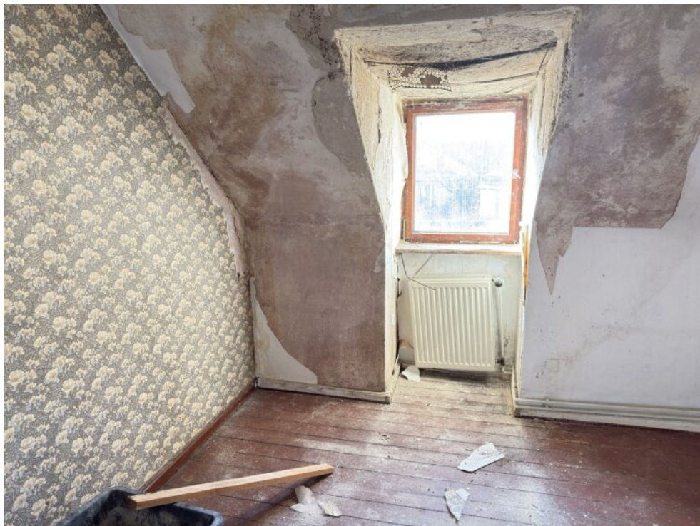
Zimmer (4) OG