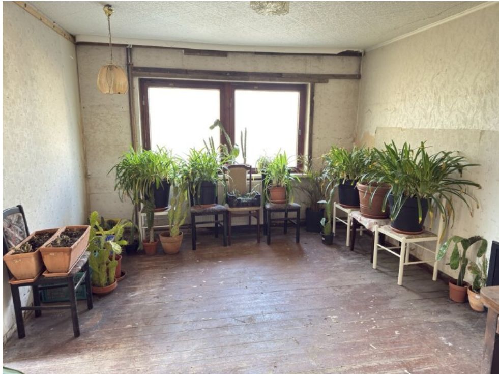
Zimmer (1) EG