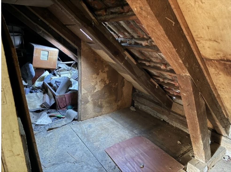
Stauraum im OG