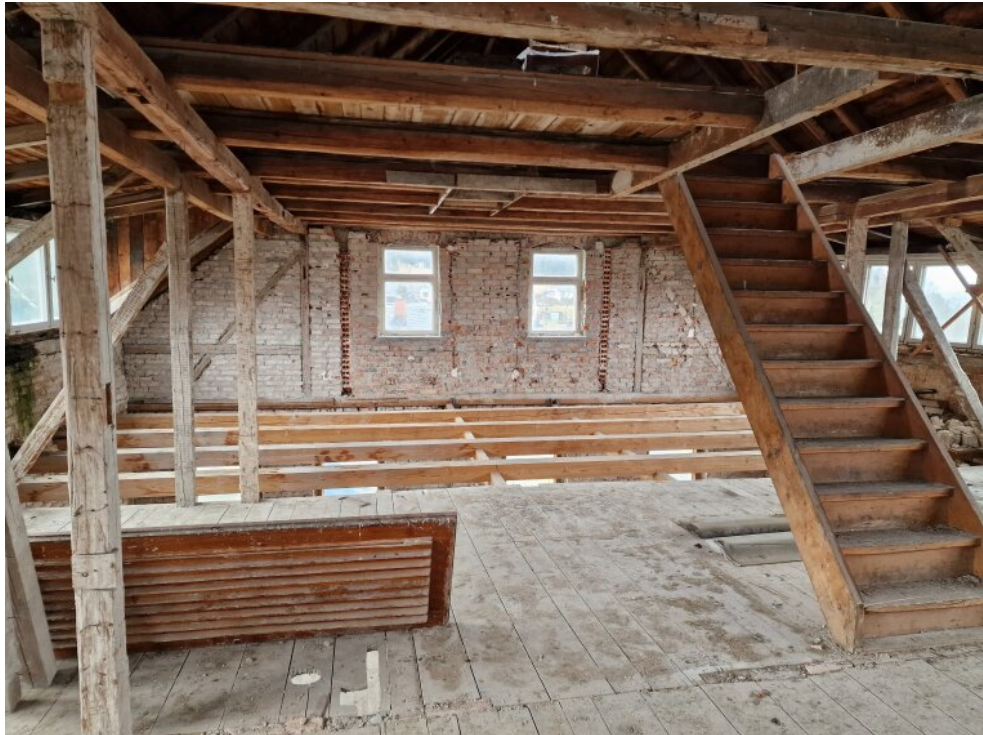
Rohbau 1. OG