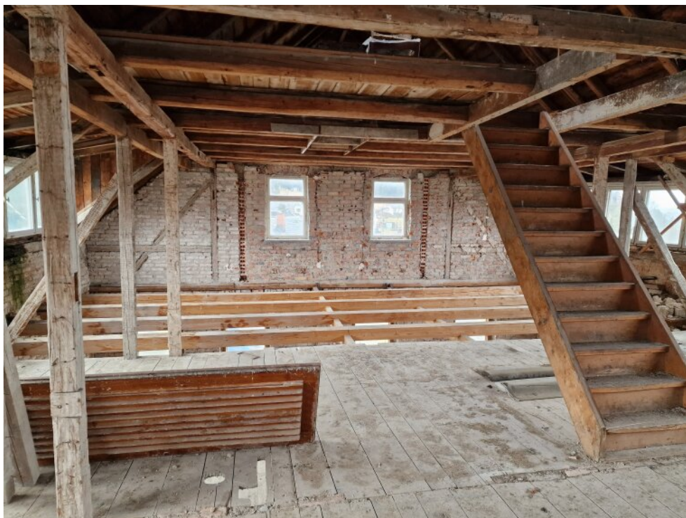
Rohbau 1. OG