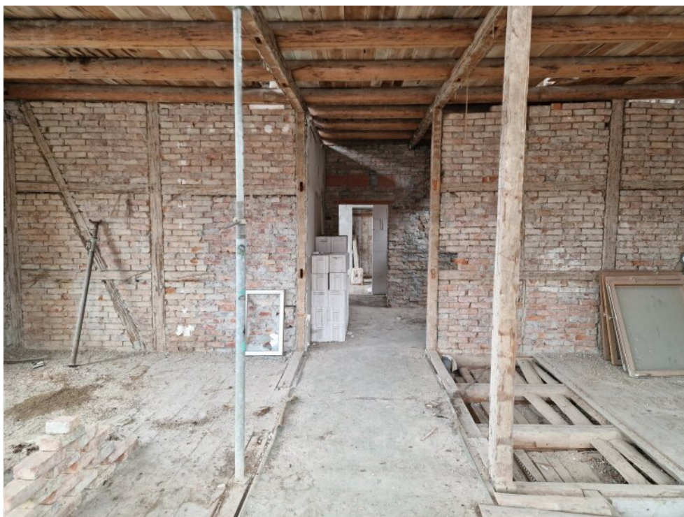
Rohbau 1. OG