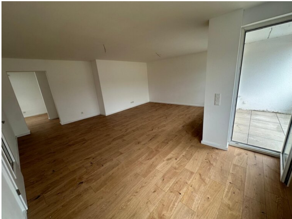
Wohnzimmer Ausgang Balkon