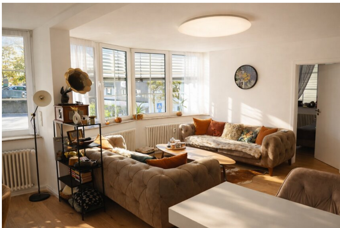
Wohnzimmer 1. OG