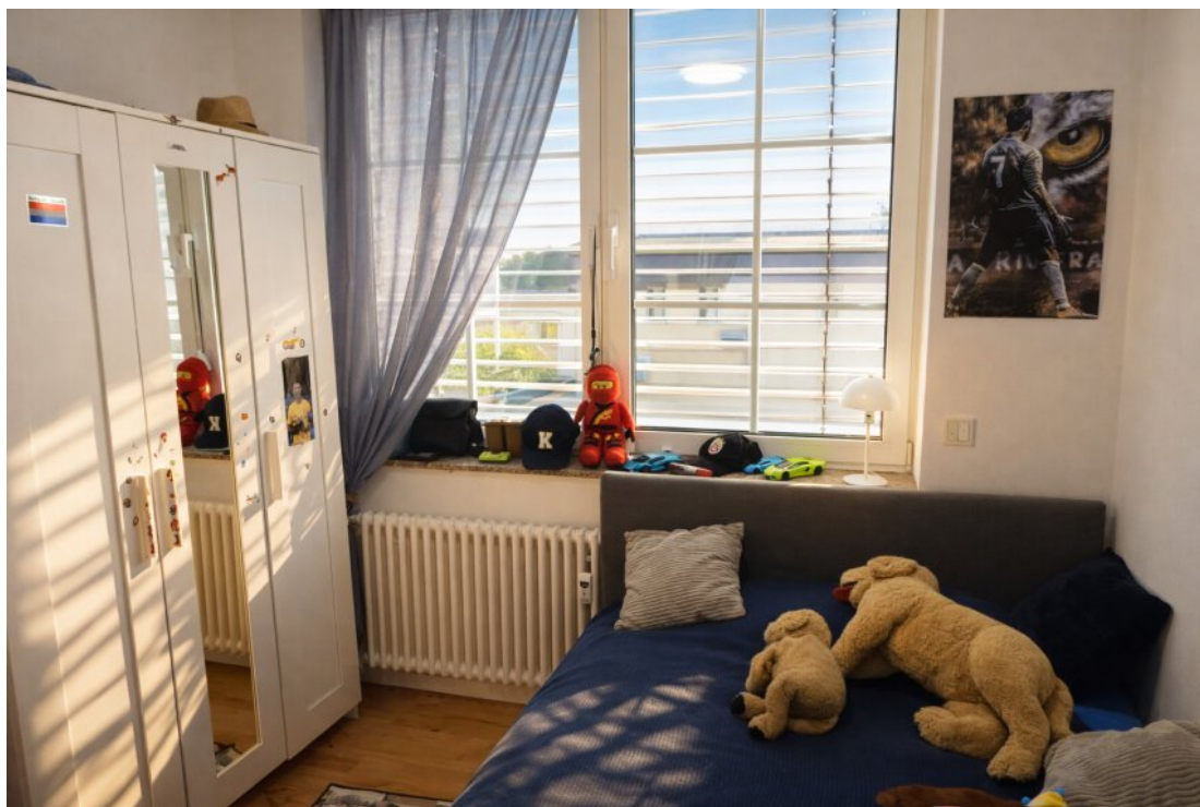
Kinderzimmer 1. OG