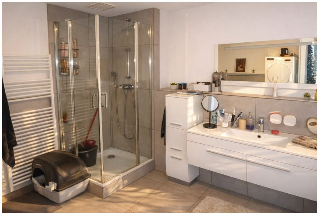
Bad Dusche 1. OG