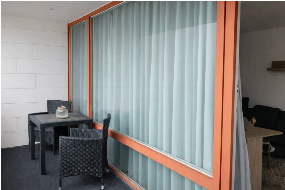
Andere Ansicht Balkon