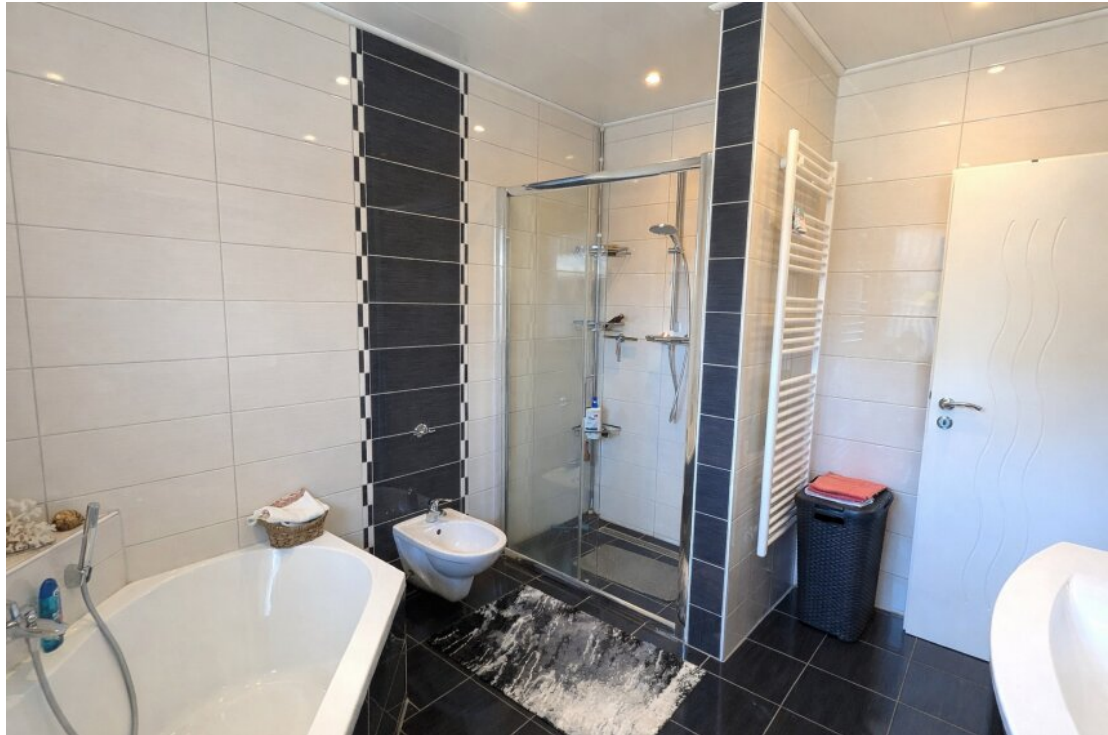
Barrierefreies Bad mit Komfort