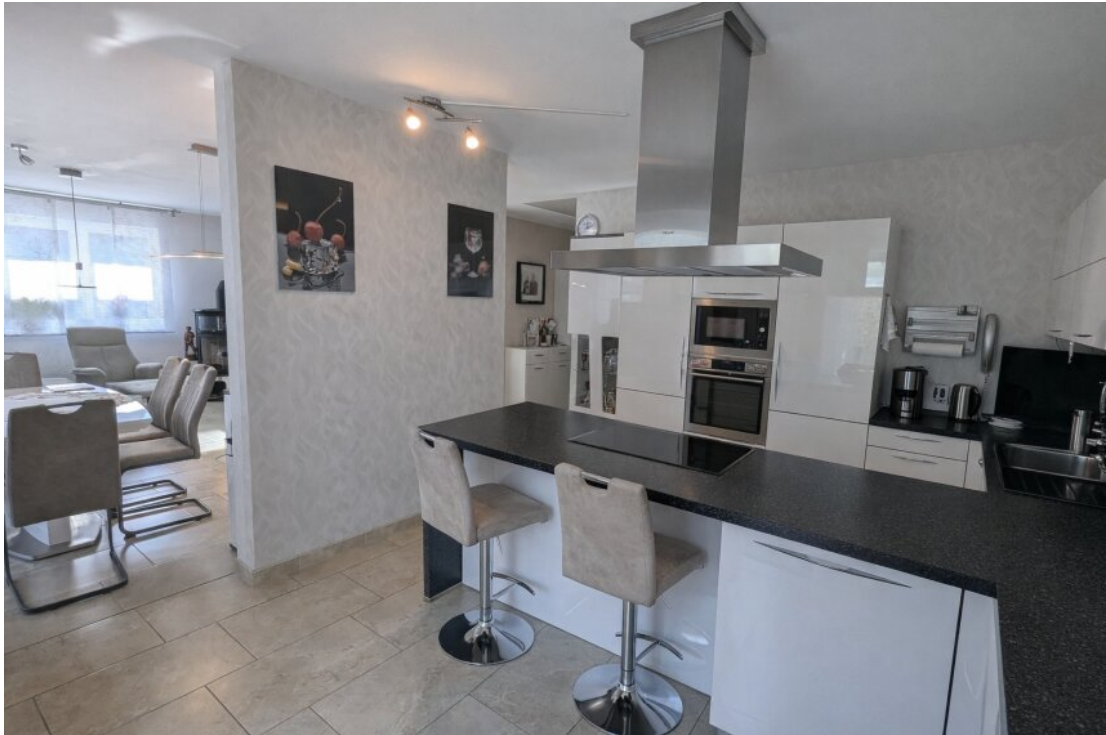
Moderne Küche Wohn-Essbereich