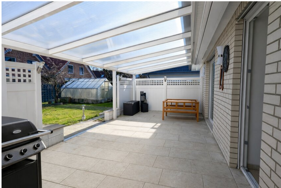
Große Terrasse vor dem Garten