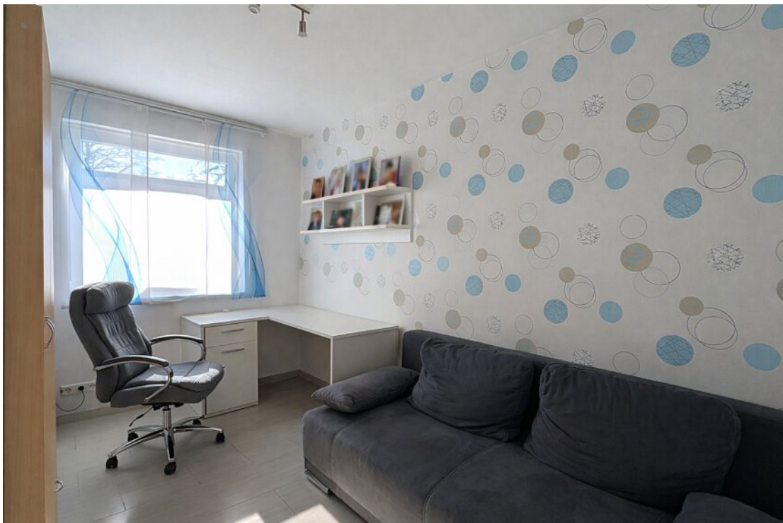
Büro oder Kinderzimmer