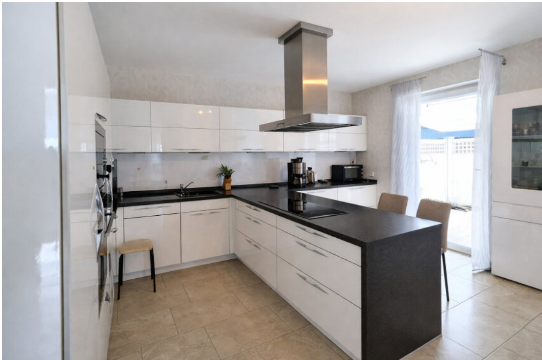
Moderne Einbauküche vor der Terrasse