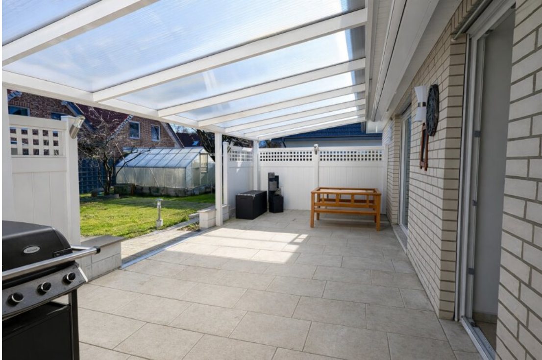
Große Terrasse vor dem Garten