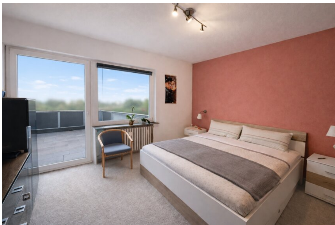
ChatGPT Image 26. Feb. 2026, 10_50_28