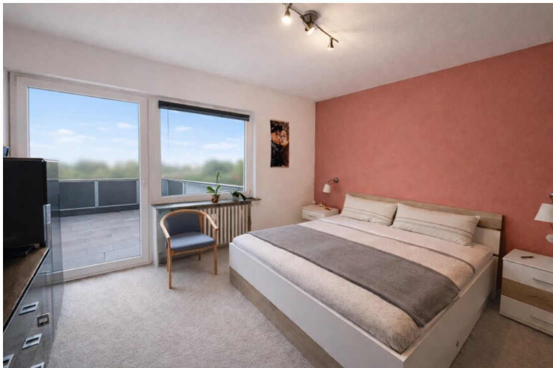
ChatGPT Image 26. Feb. 2026, 10_50_28