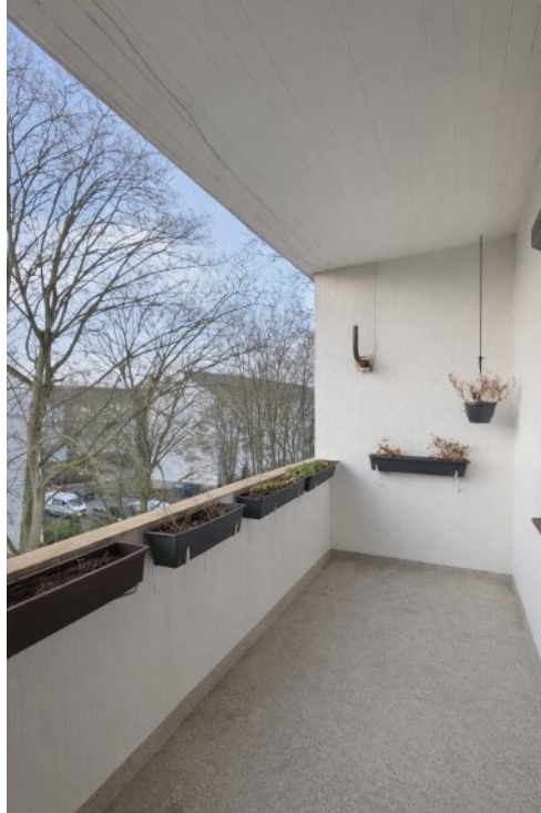
Der sonnige Balkon