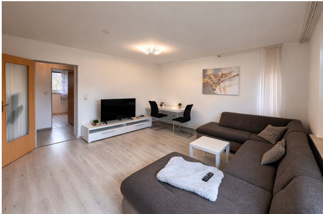
Großes Wohnzimmer mit Balkon +