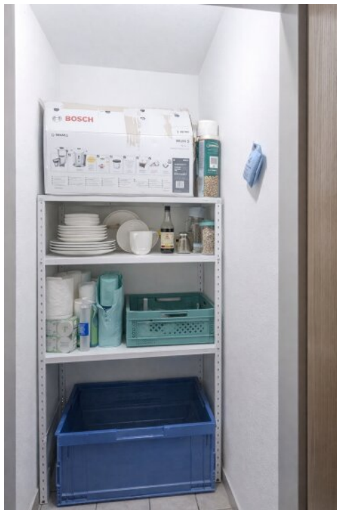
Kleiner Abstellraum in der Woh