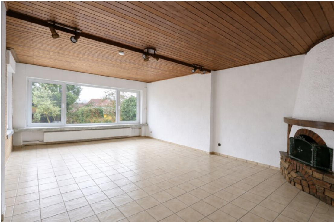
Wohnzimmer mit Deko-Kachelofen