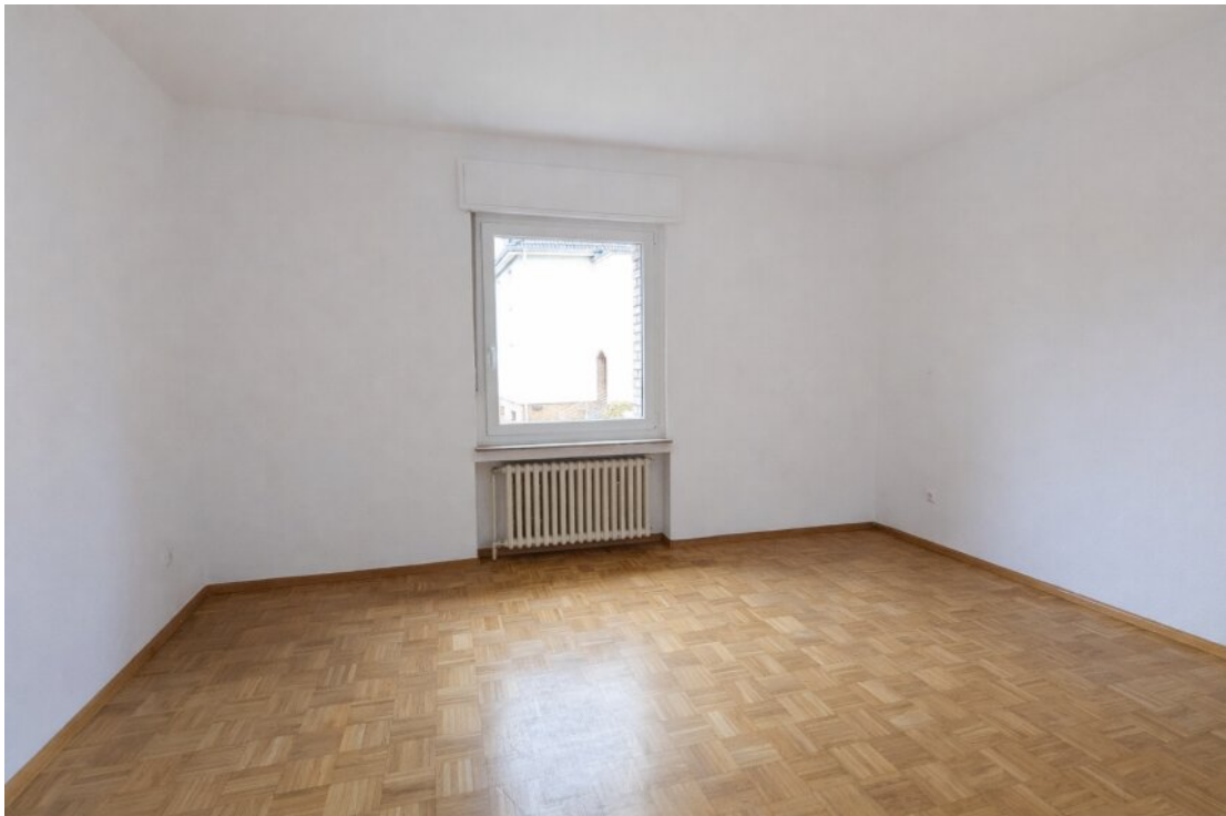
Schlafzimmer 1 mit Echtholzparkett