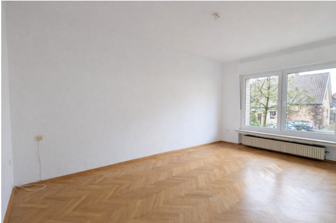
Schlafzimmer 2 mit Echtholzparkett