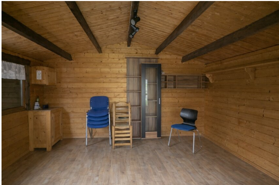
Komfortables Gartenhaus von innen