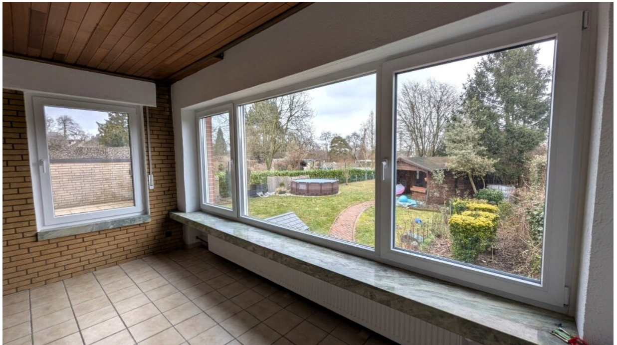
Wunderbare Aussicht auf die Terrasse