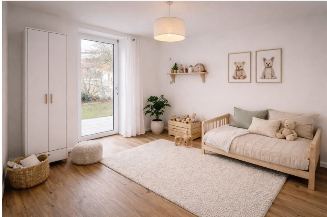
Kinderzimmer mit Homestaging