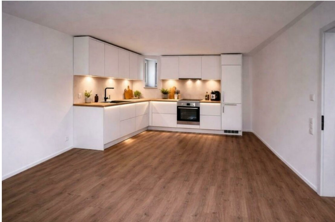
Küche mit Homestaging