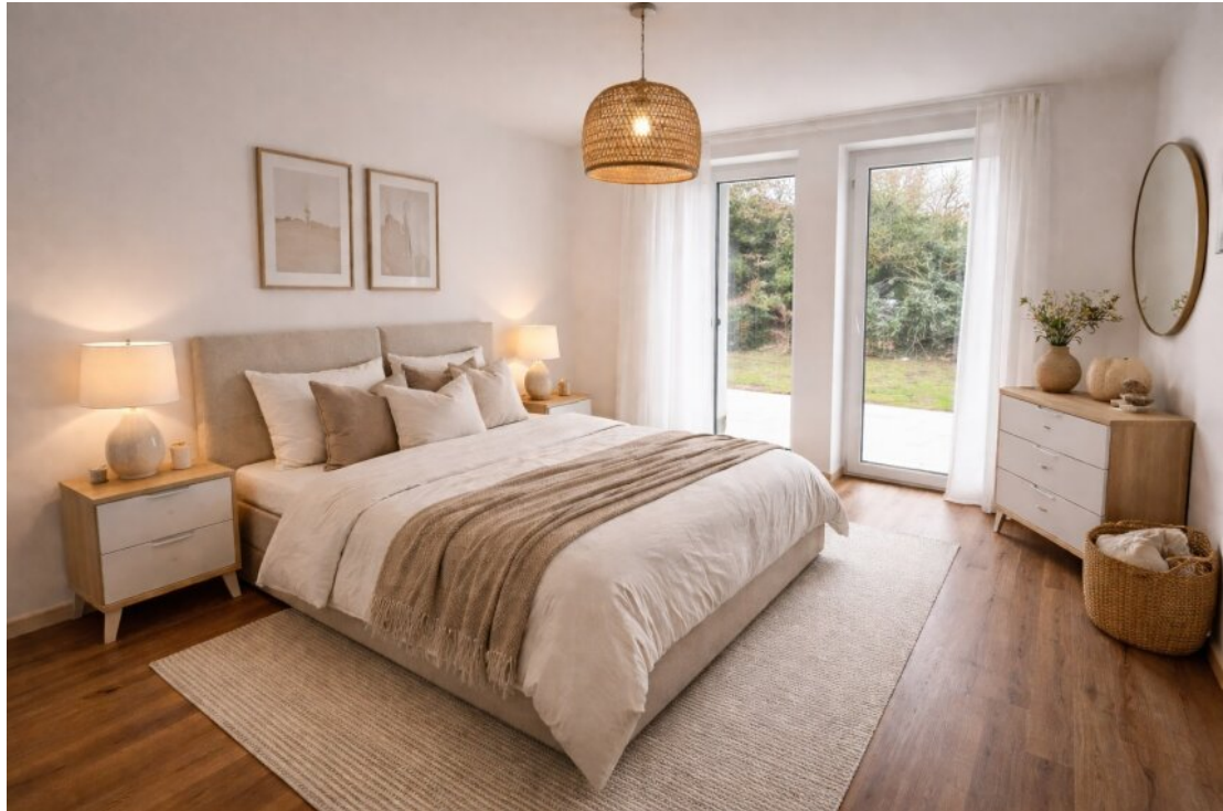
Schlafzimmer mit Homestaging