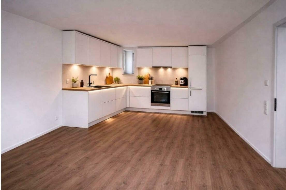
Küche mit Homestaging