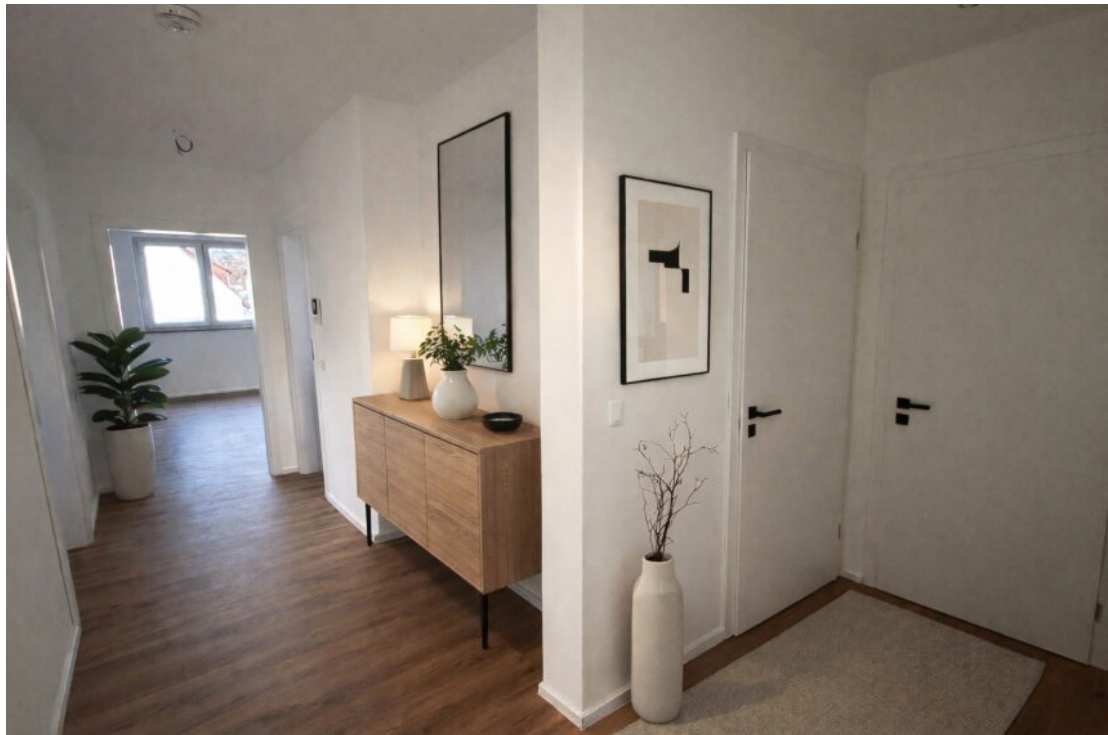
Flur mit Homestaging