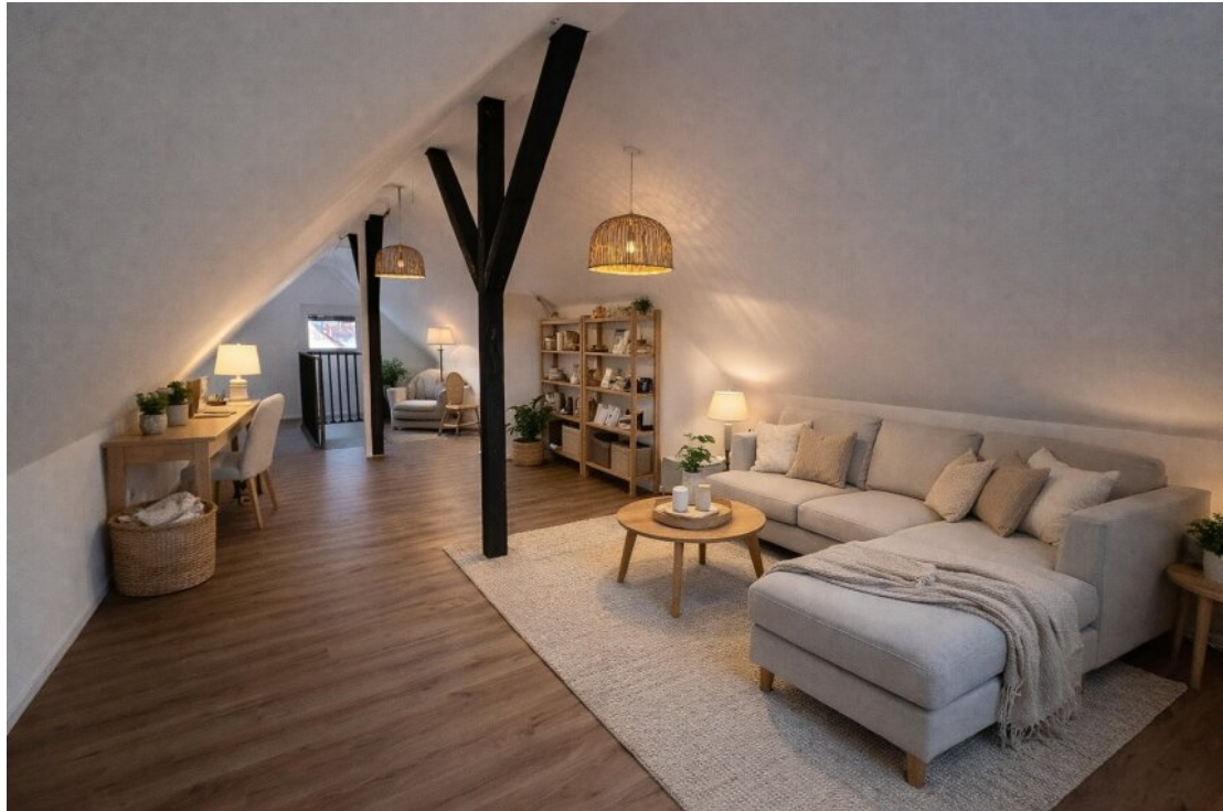
Bühne mit Homestaging