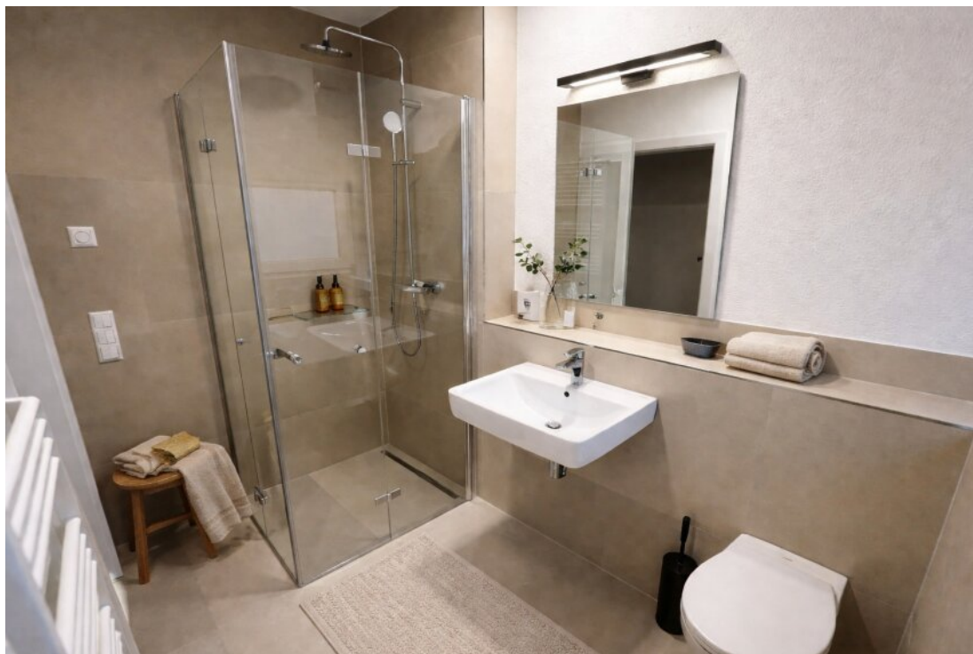
Badezimmer mit Homestaging