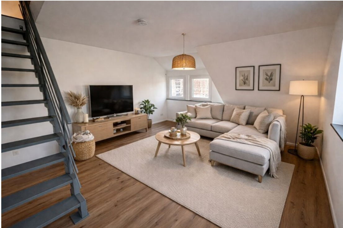
Wohnzimmer mit Homestaging