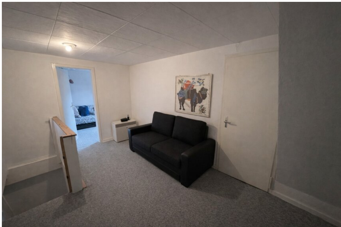
Whg. 2 Flur (DG)