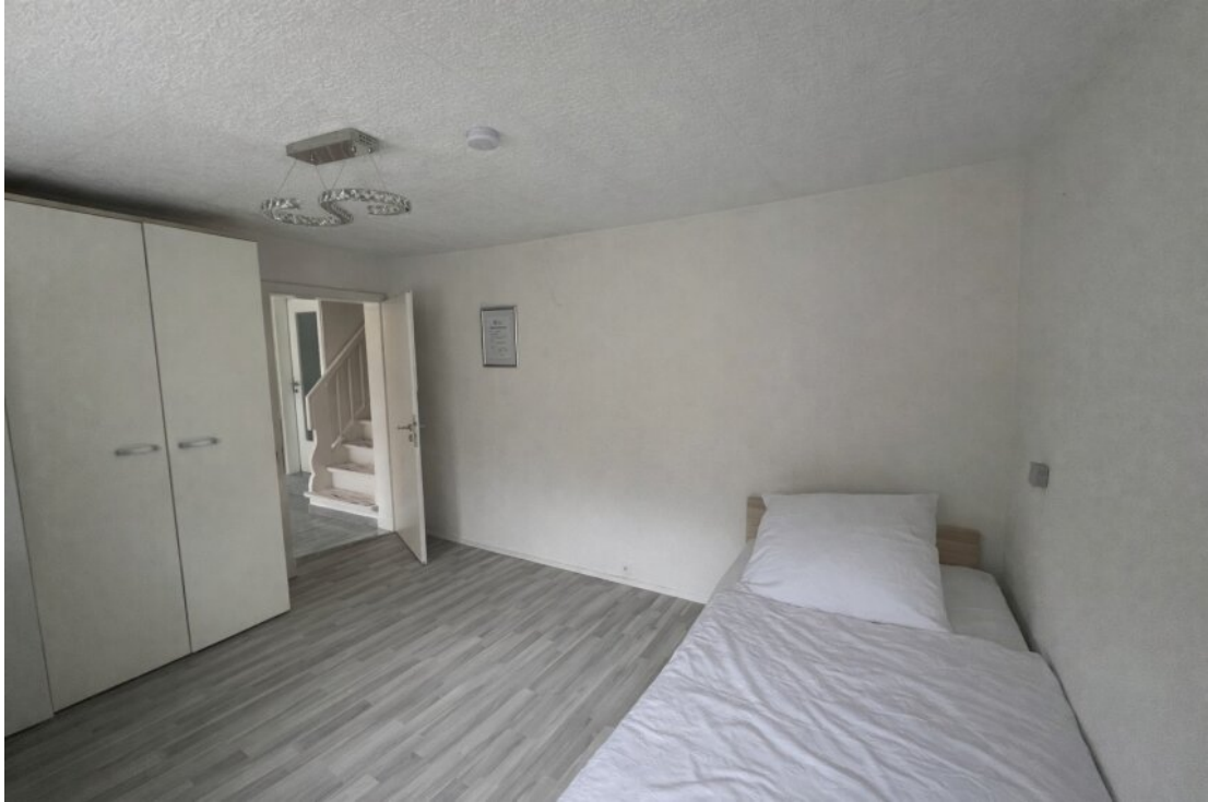
Whg. 1 Schlafzimmer Nr. 2 (EG)