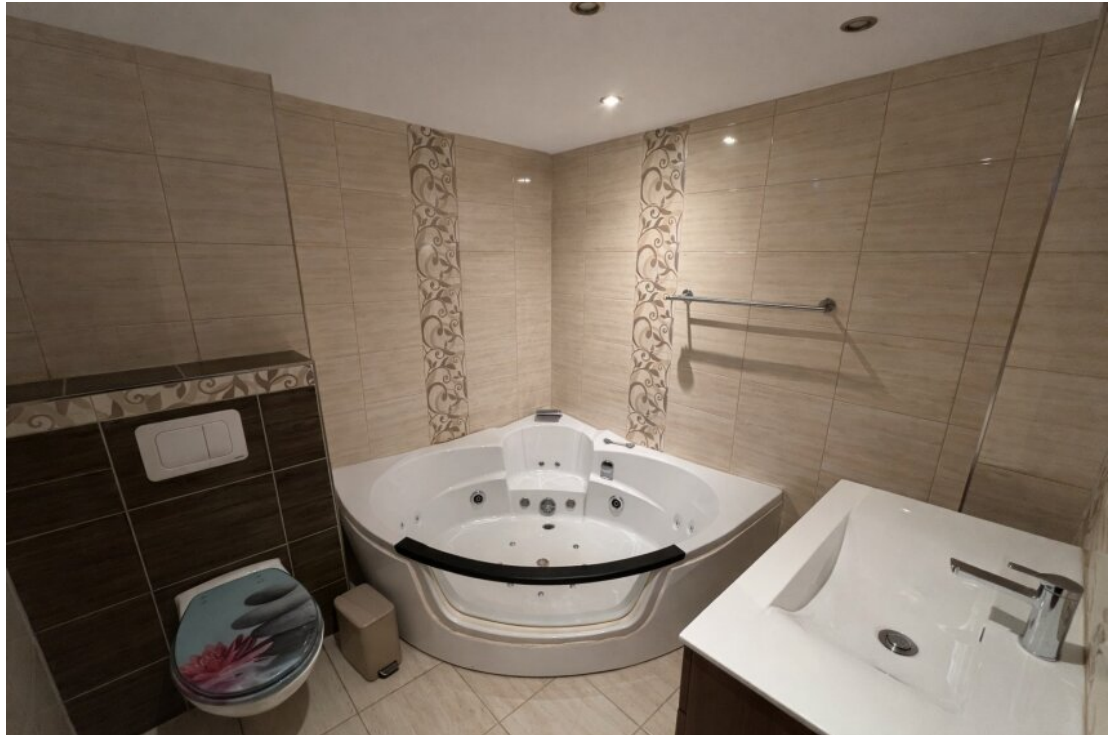
Whg. 2 Badezimmer (OG)