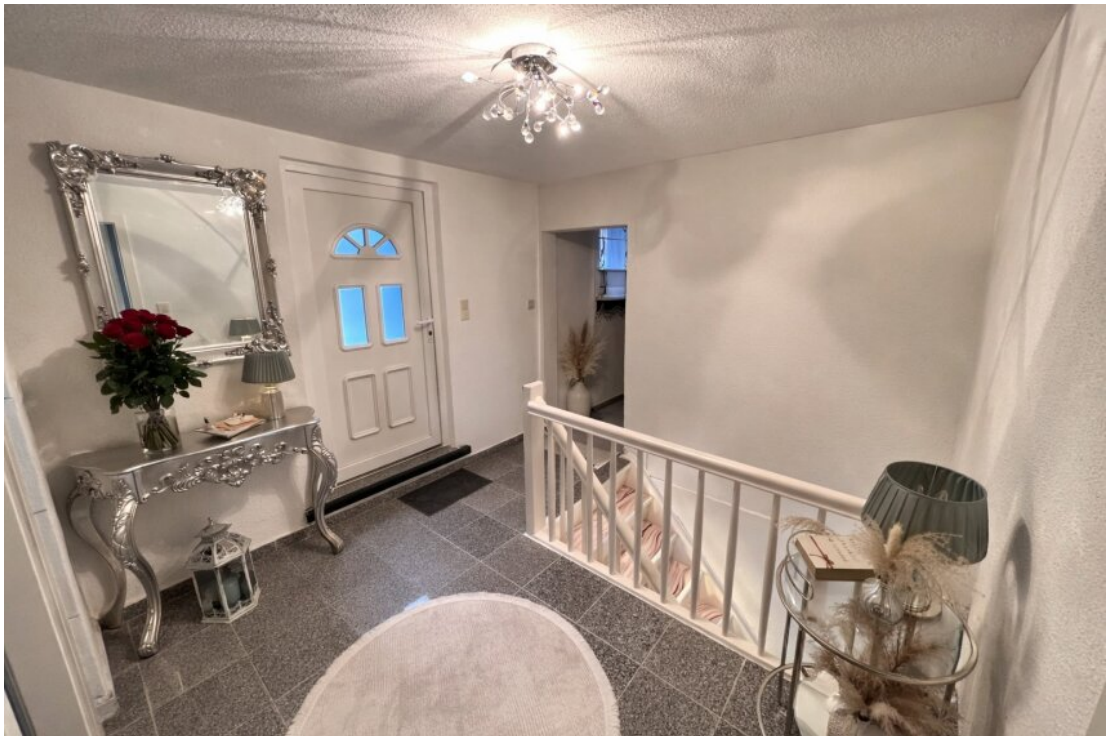
Whg. 2 Eingangsbereich (OG)