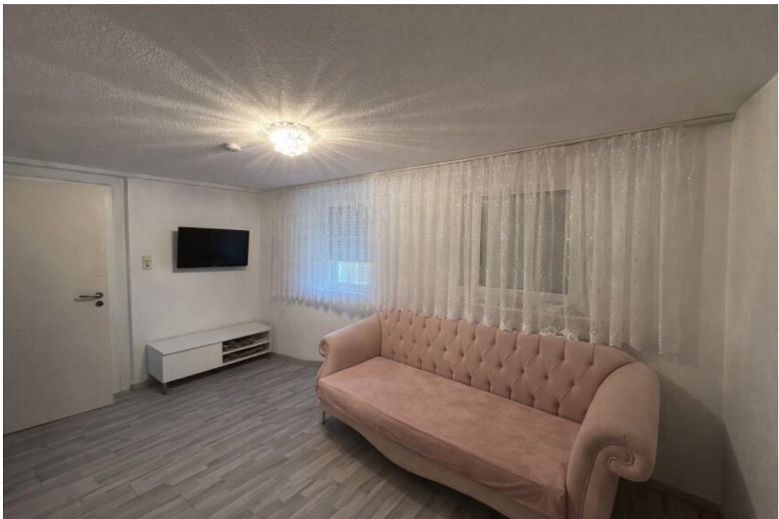
Whg. 1 Schlafzimmer Nr. 1 (EG)