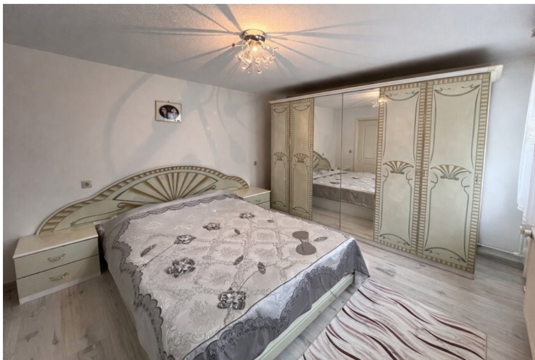
Whg. 2 Schlafzimmer (OG)