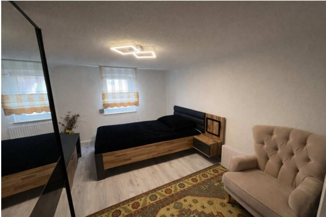
Whg. 2 Kinderzimmer Nr. 1 (DG)