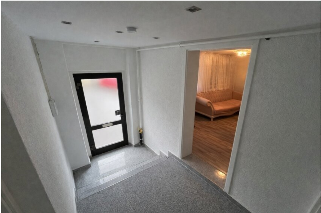
Whg. 1 Eingangsbereich (EG)