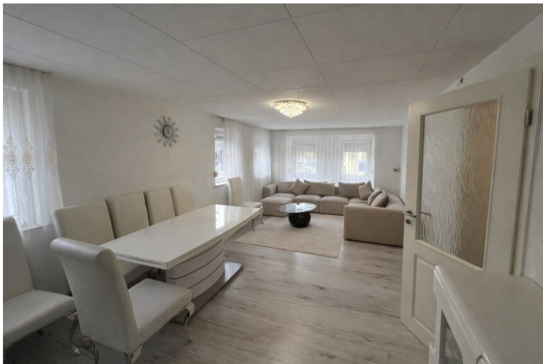
Whg. 2 Wohn-und Essraum (OG)