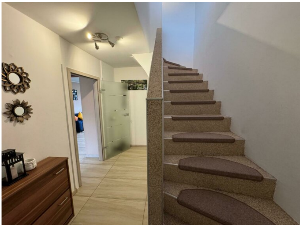
Treppe ins Obergeschoss