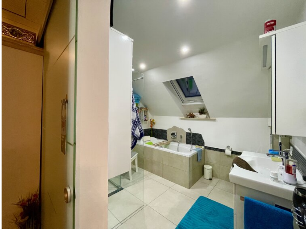
Bad mit Wanne und Dusche