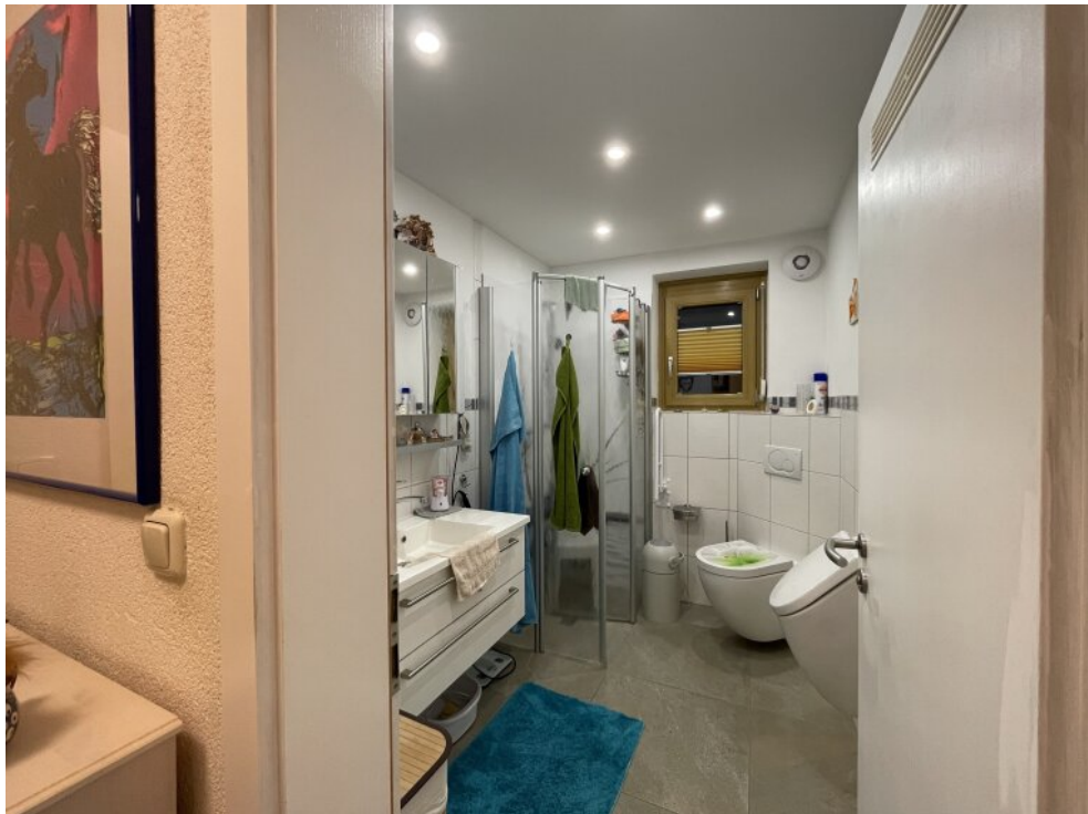
Bad im EG