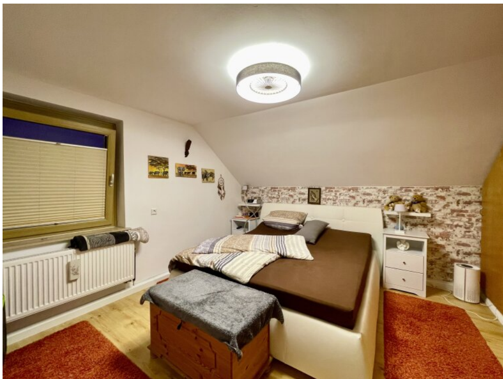
Schlafzimmer 1 im OG