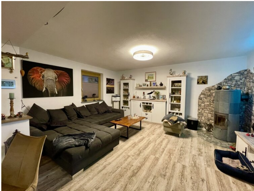
Wohnzimmer mit Kaminofen