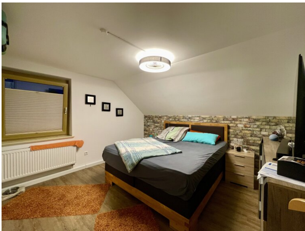
Schlafzimmer 2 im OG