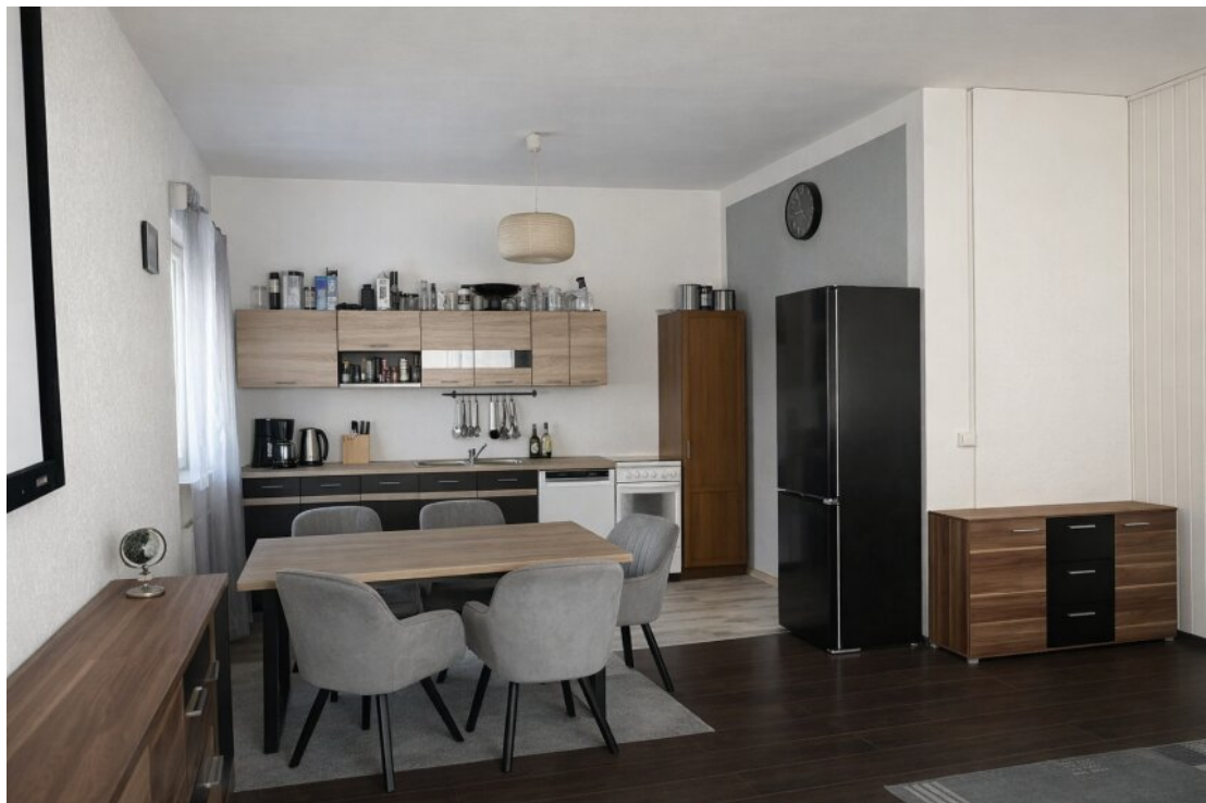
Küche & Essbereich