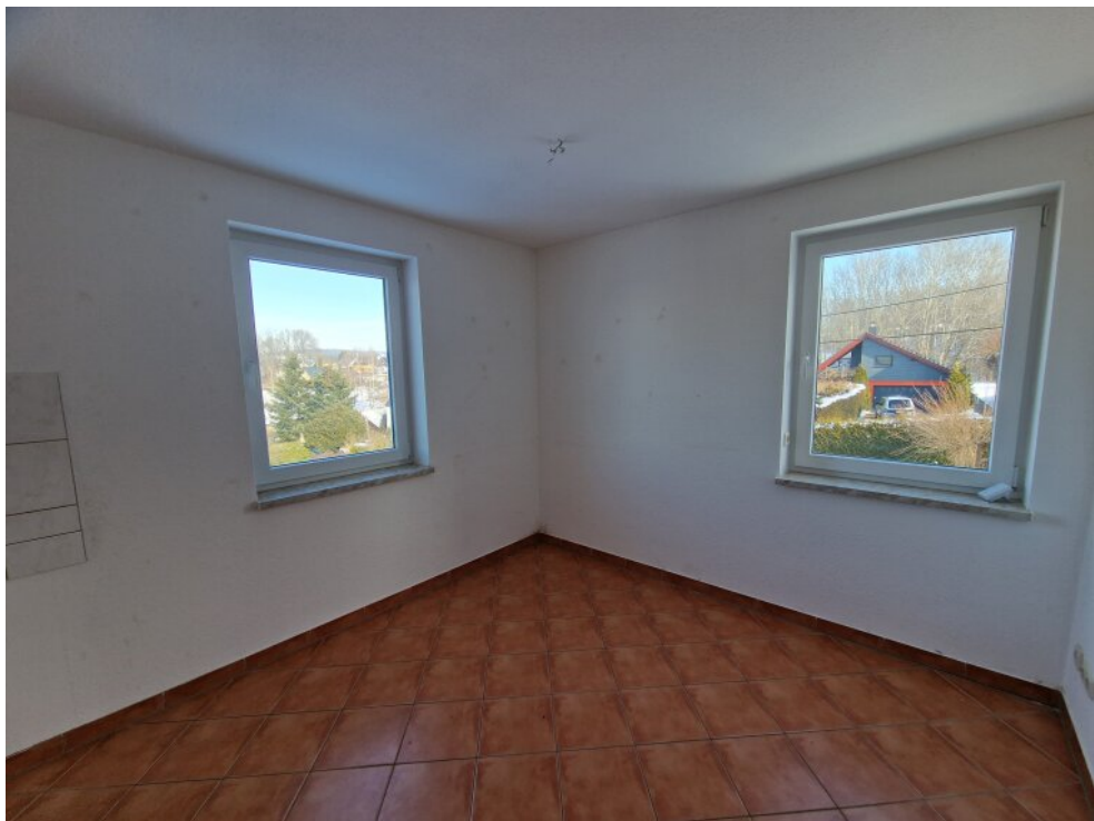
Küche 1. OG