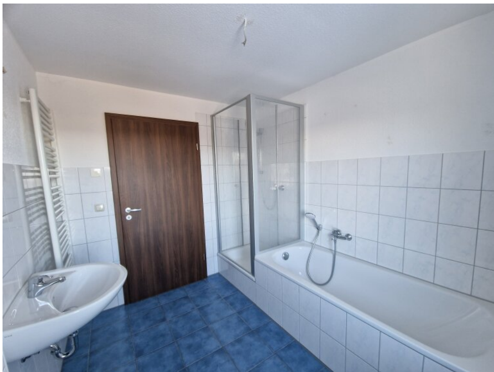
Bad 1. OG