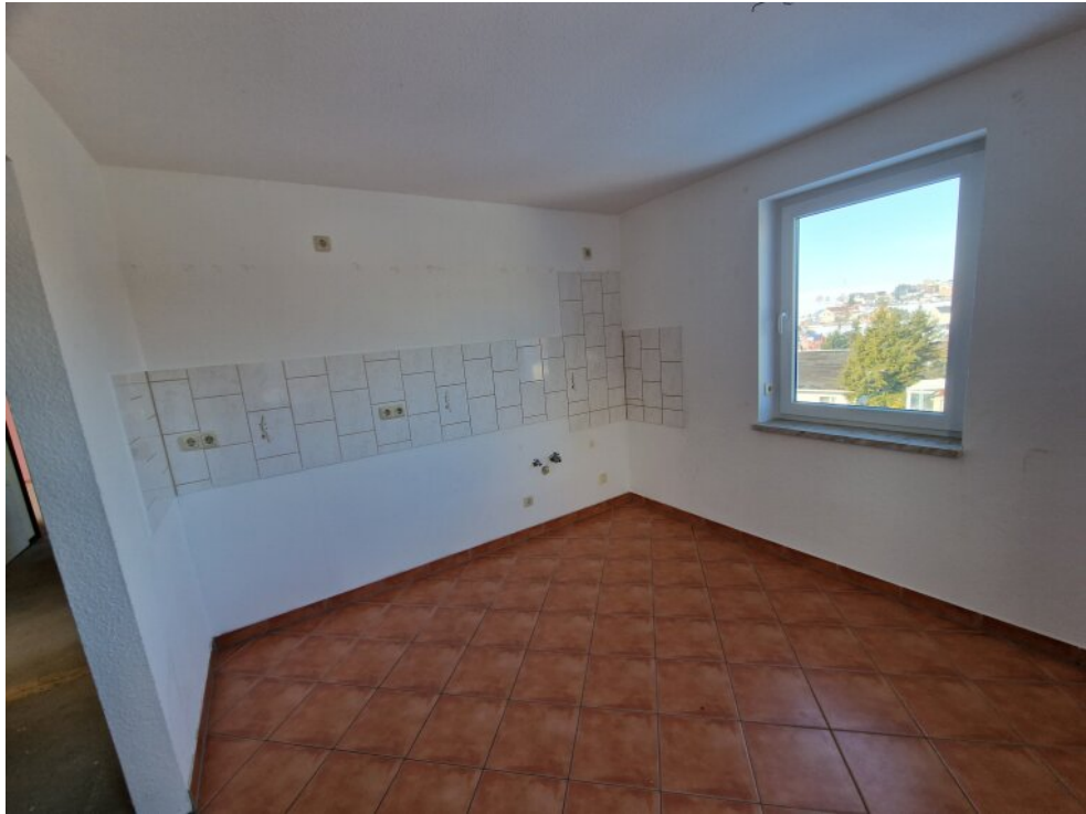
Küche 1. OG