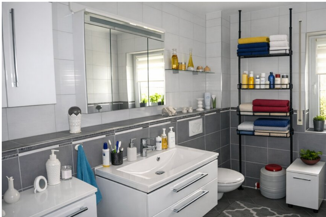
Tageslicht Bad OG