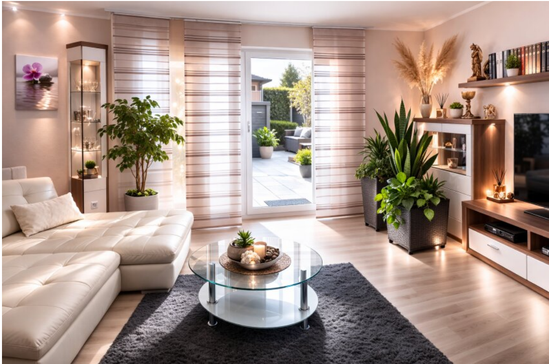
Wohnzimmer Ausgang Terrasse und Garten