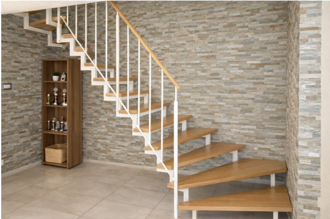
Aufgang OG DG