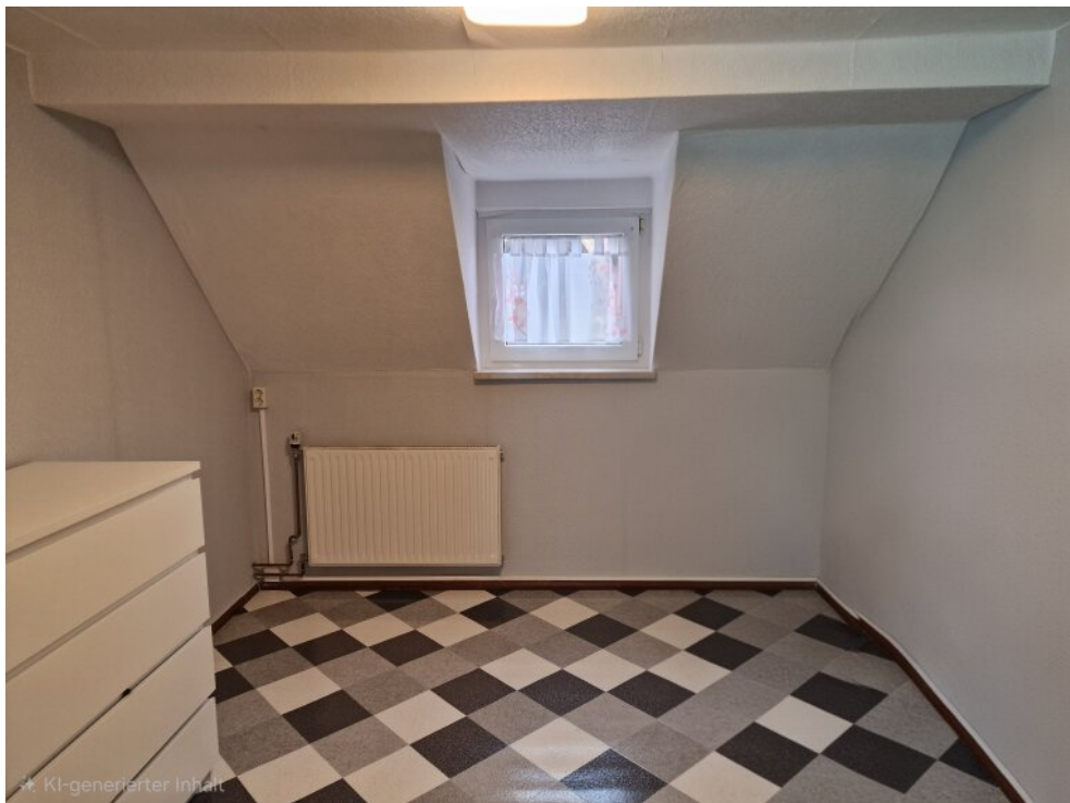
Zimmer 4 - 2. OG