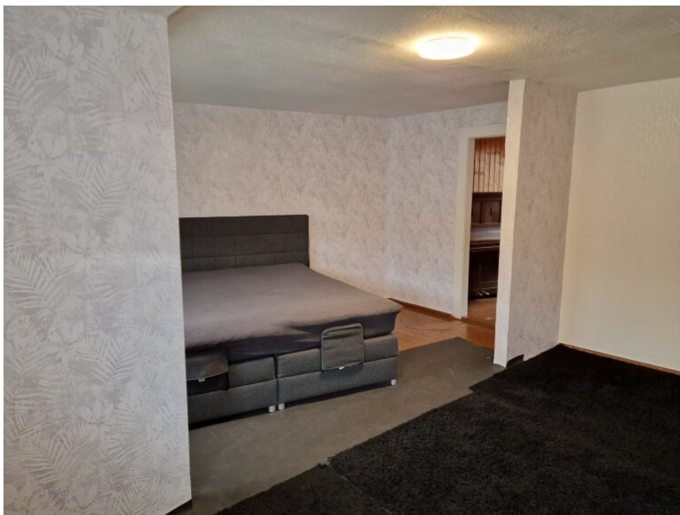
Schlafzimmer - 2. OG