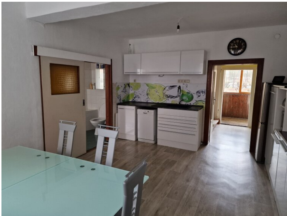
Küche mit Eßbereich