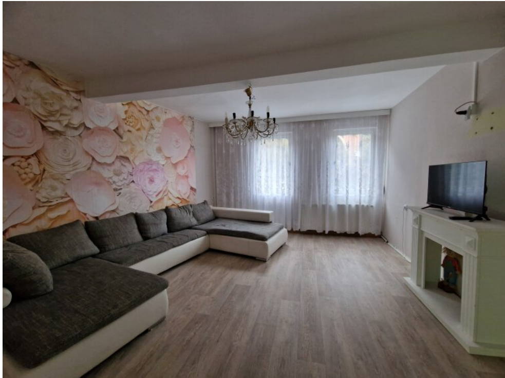
Wohnzimmer 1. OG