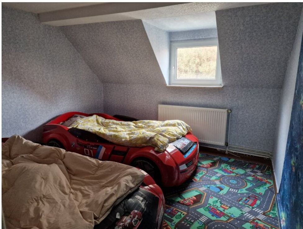
Zimmer 3 - 2. OG