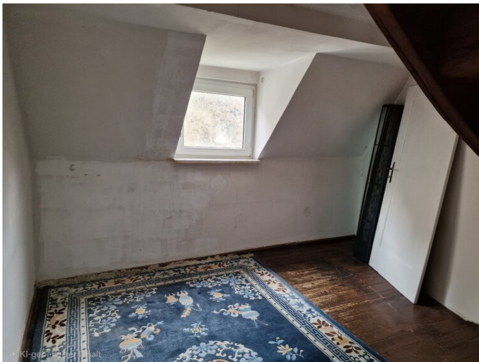
Zimmer 5 - 2. OG