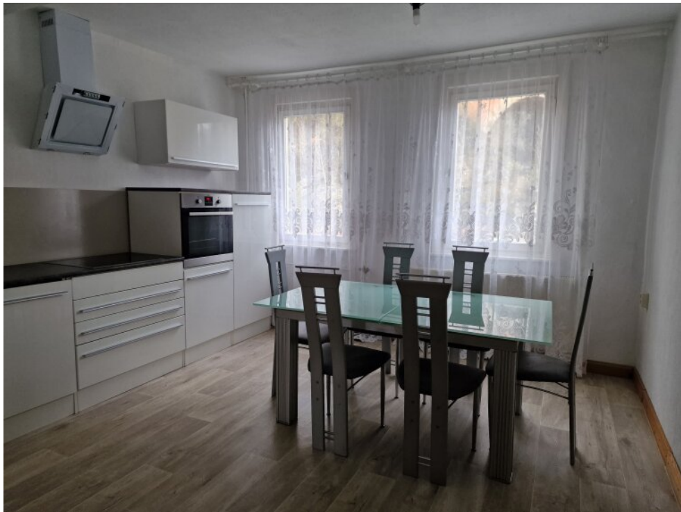
Küche im 1. OG