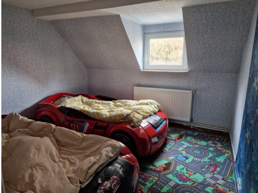
Zimmer 3 - 2. OG