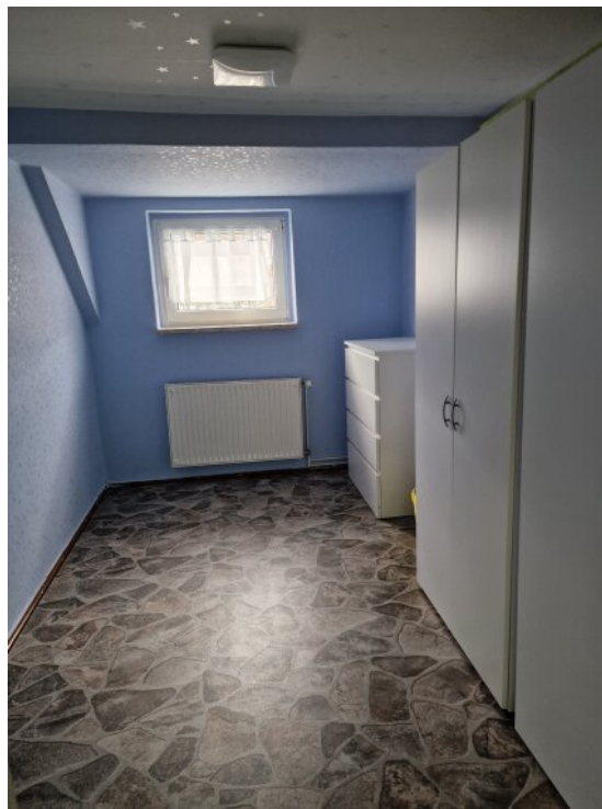
Zimmer 2 - 2. OG