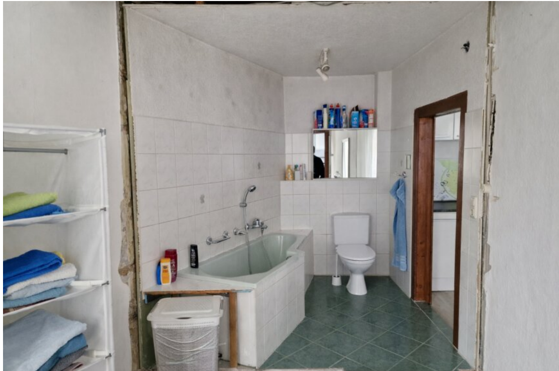
Badezimmer 1. OG