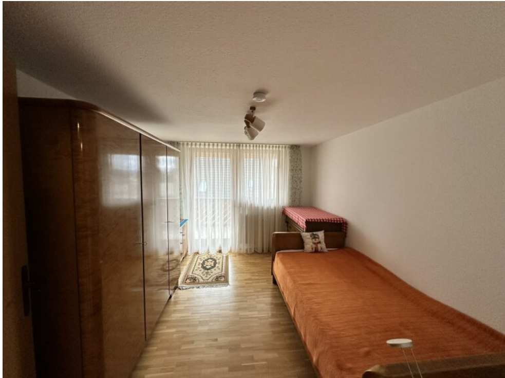
Schlafzimmer 1 - Balkon