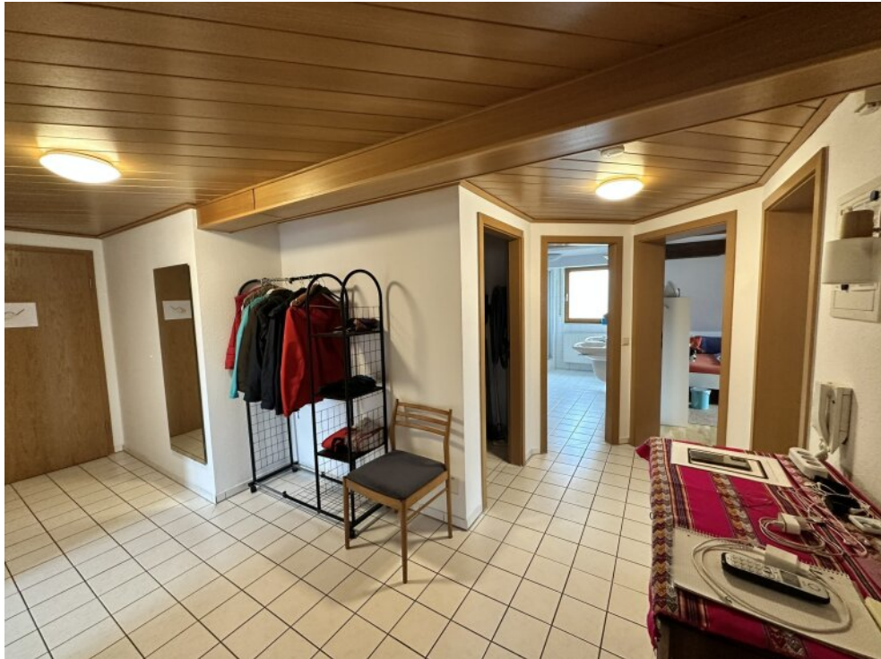
Flur mit Abstellkammer