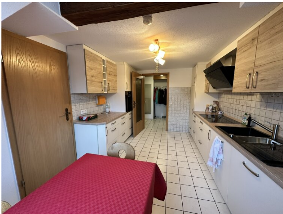
Küche + Essbereich