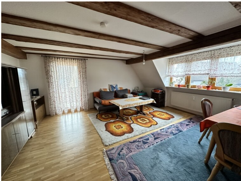
Wohn-/ Esszimmer / Balkon