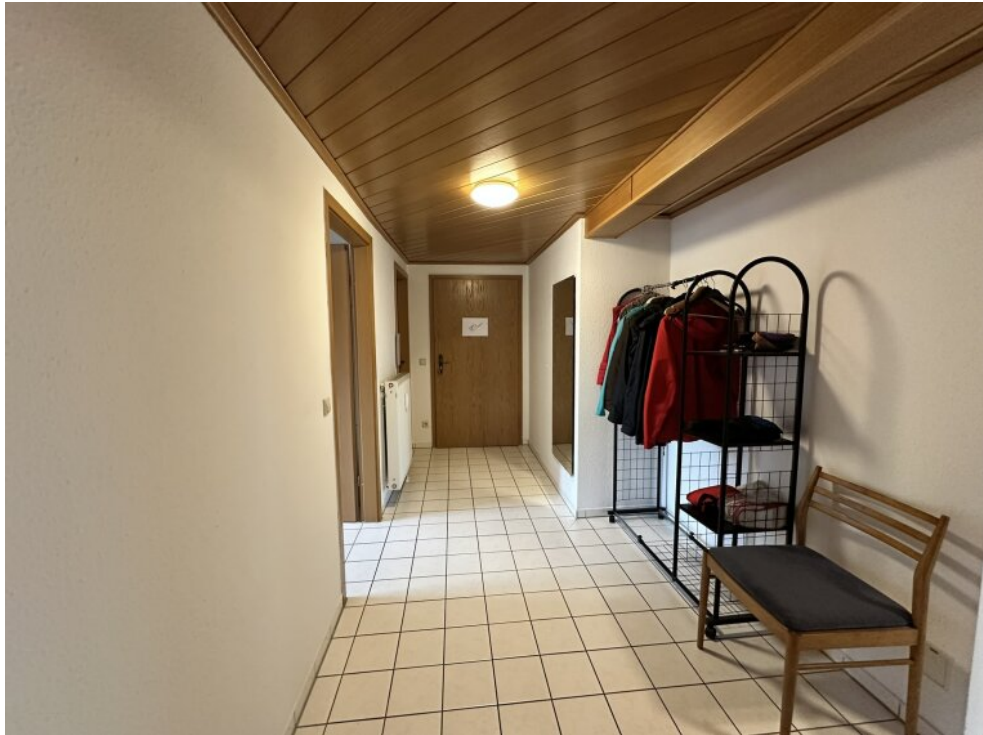
Flur / Eingangsbereich