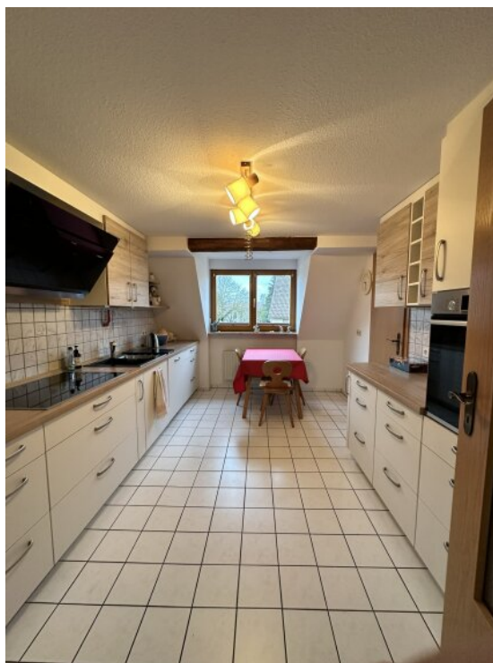
Küche + Essbereich