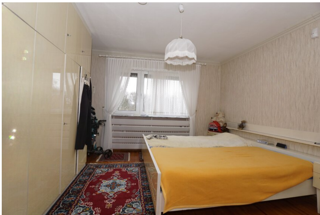
EG Schlafzimmer mit Terrassenzugang