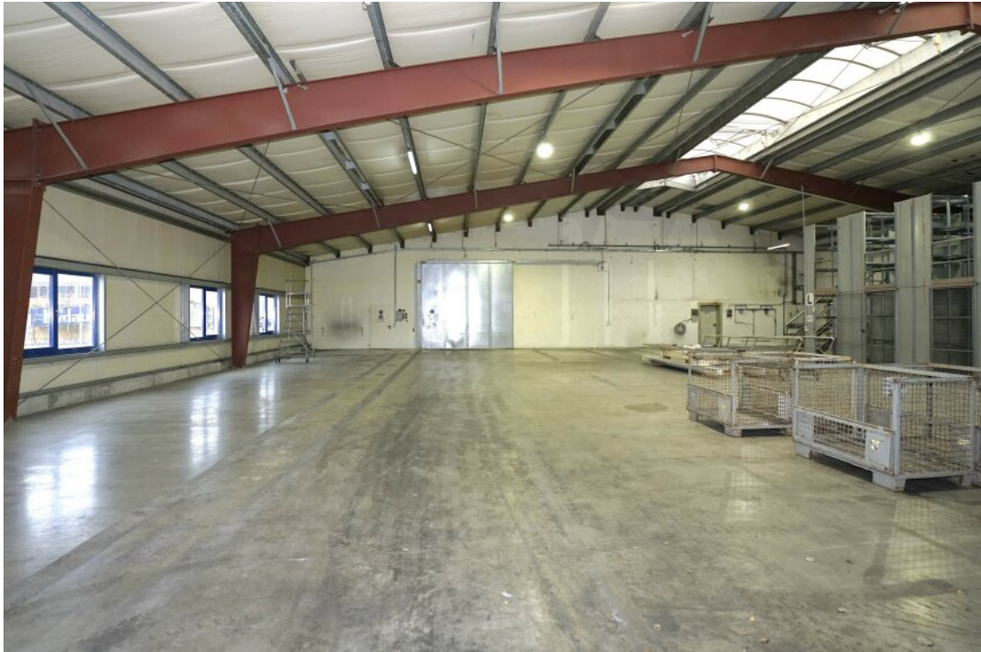
36 hintere Halle