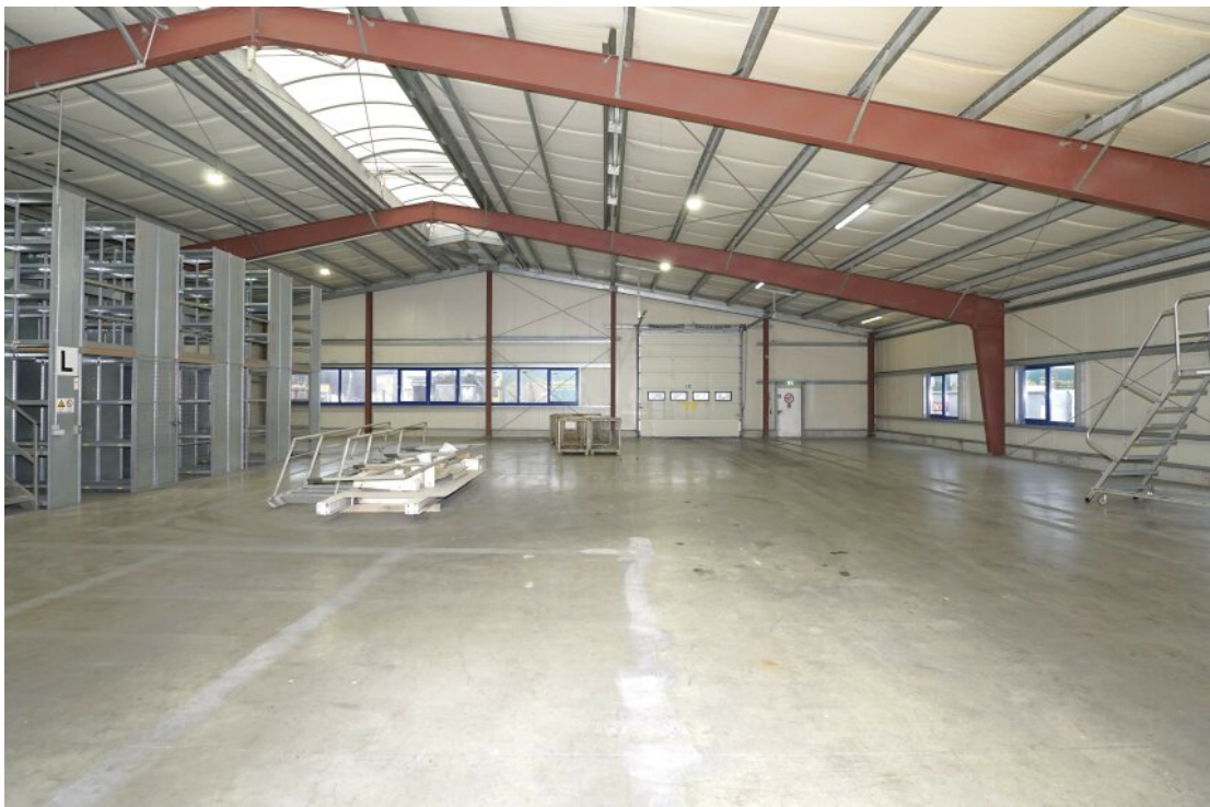
35 hintere Halle