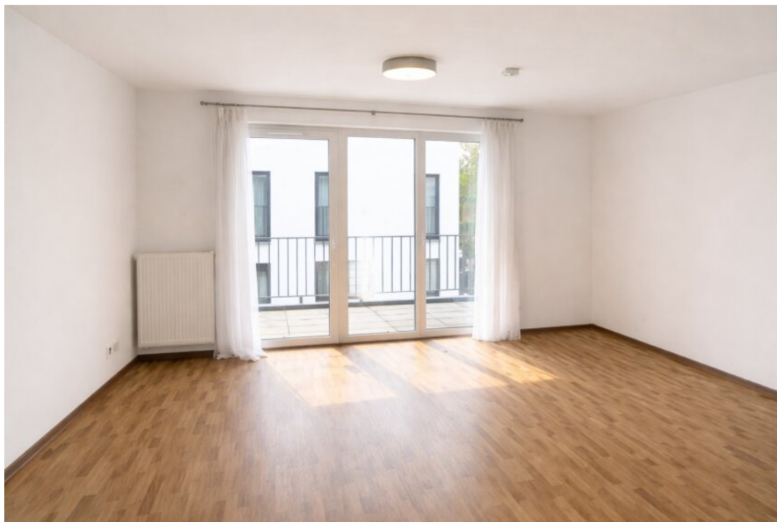
Eingang und Zugang Balkon