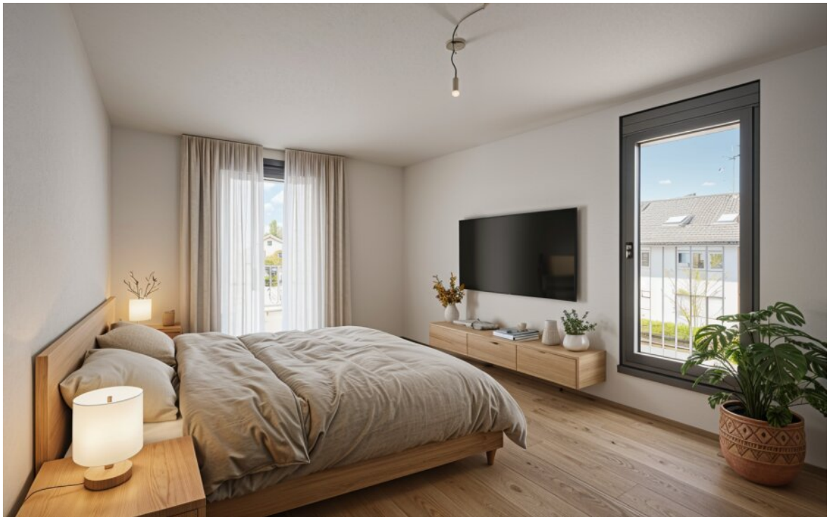
We 10 Schlafzimmer