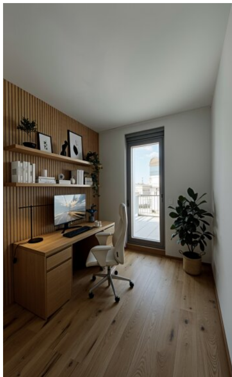
WE 10 Arbeitszimmer