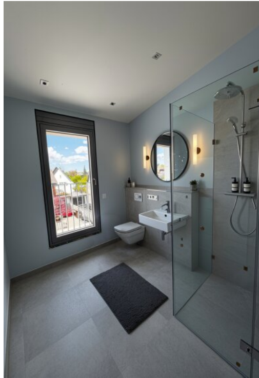
WE 10 Bad