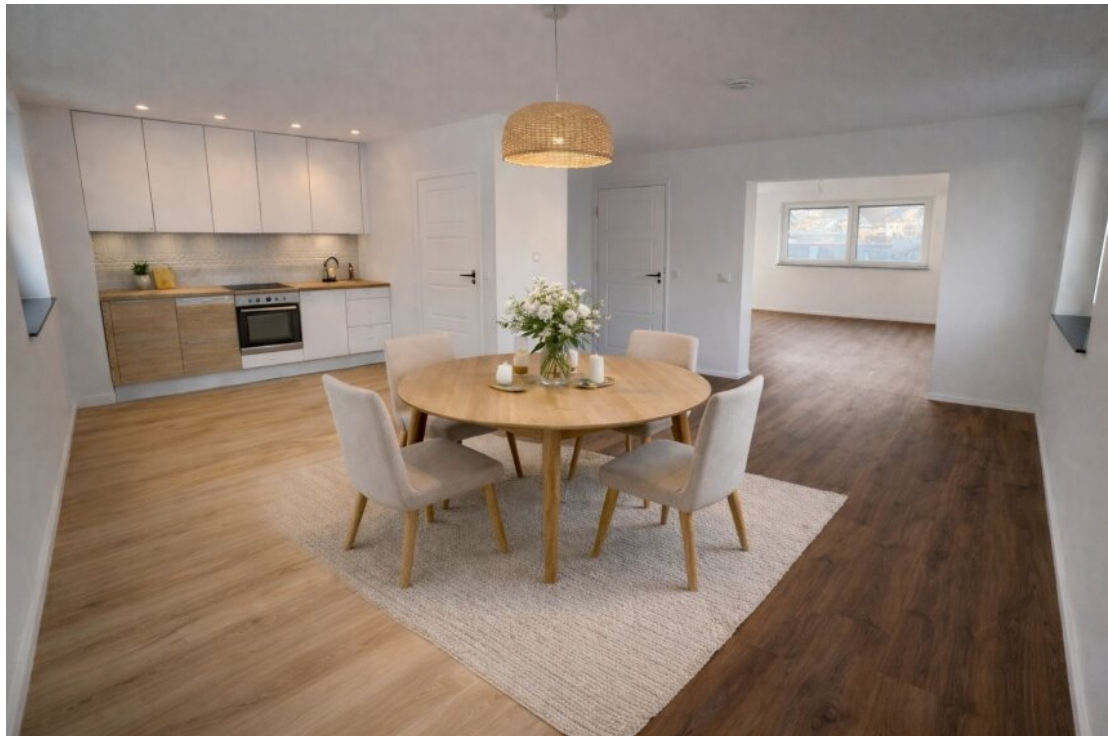
Essen + Küche mit Homestaging