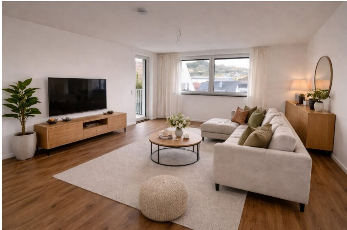
Wohnzimmer mit Homestaging