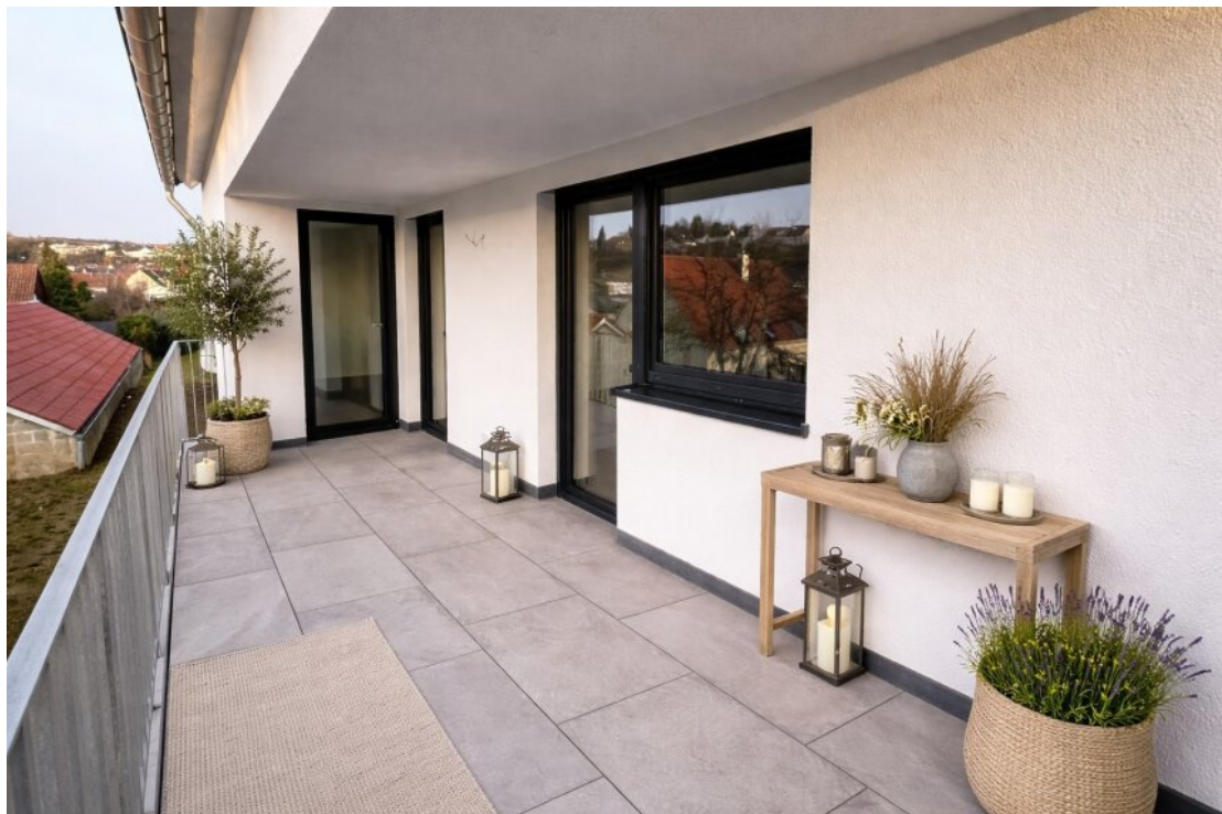
Balkon mit Homestaging