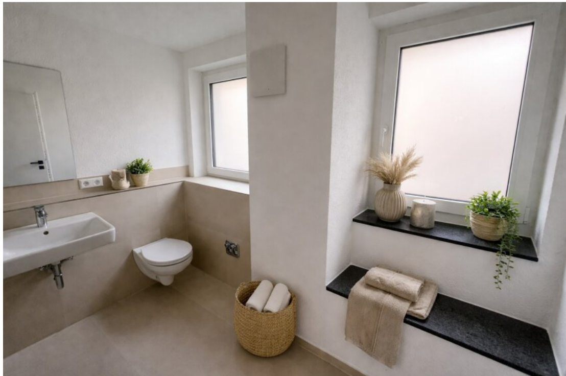
Badezimmer mit Homestaging