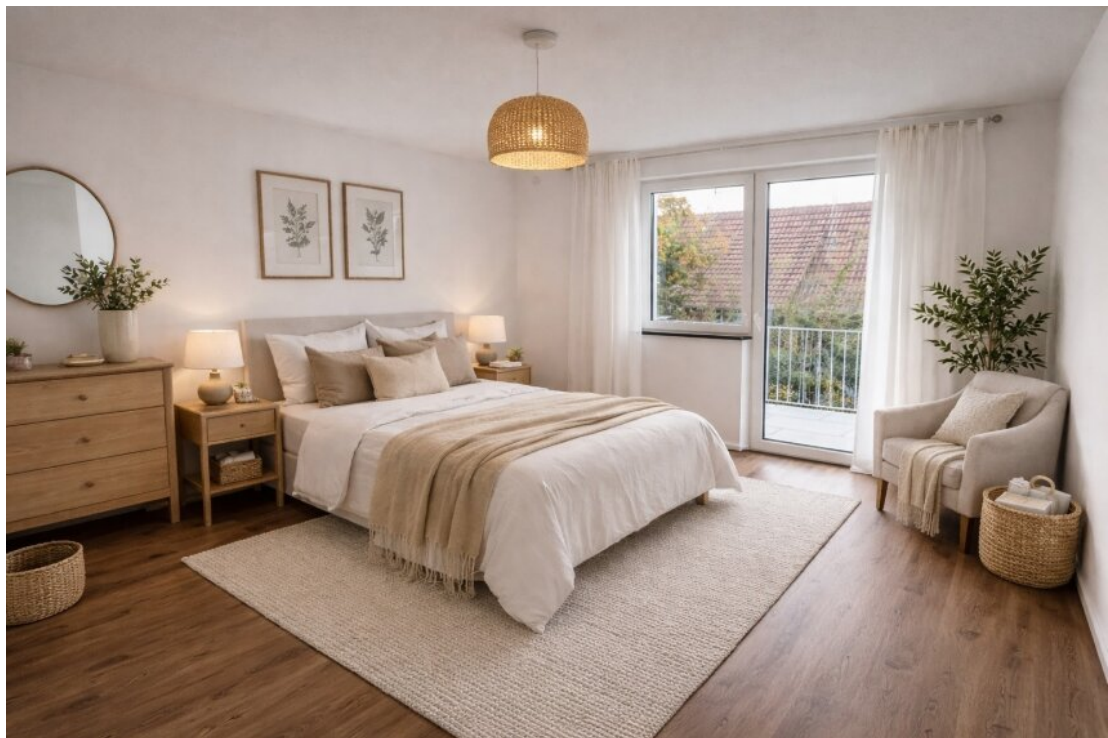
Schlafzimmer mit Homestaging