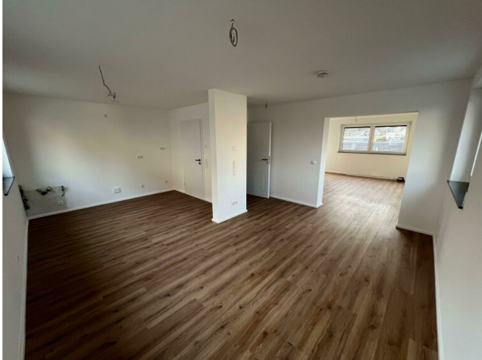
Essen + Küche