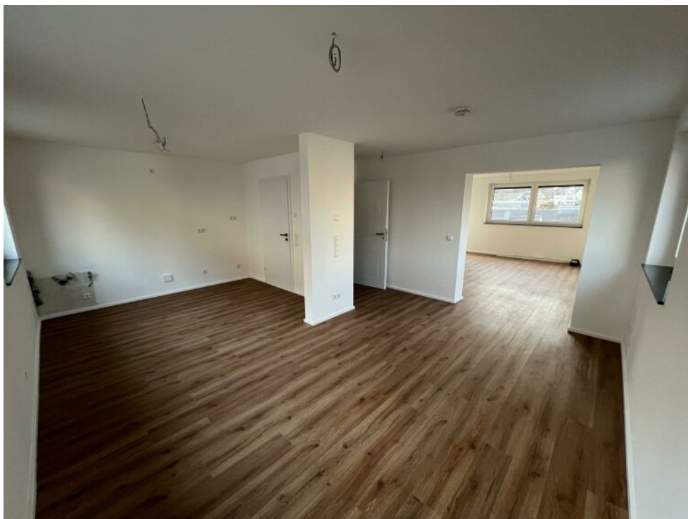
Essen + Küche