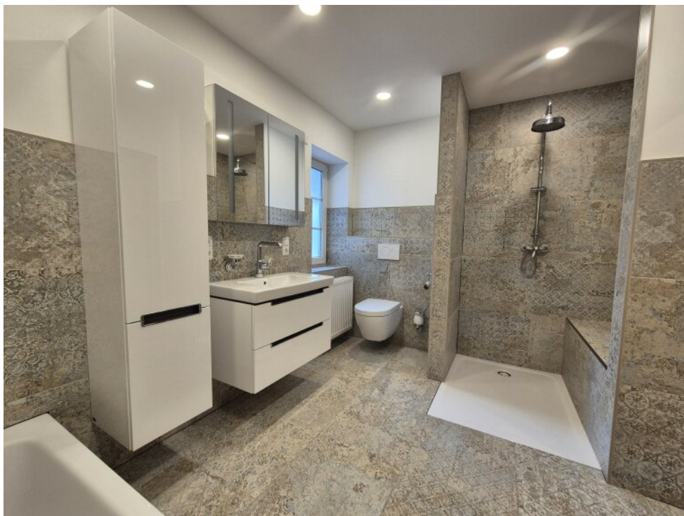
Bad mit Dusche EG