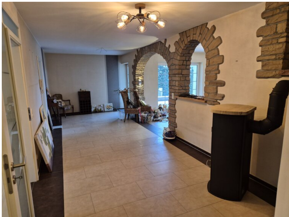
Zugang Wohn- Essbereich EG