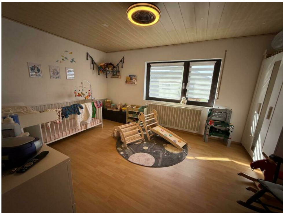
Kinderzimmer Nr. 2