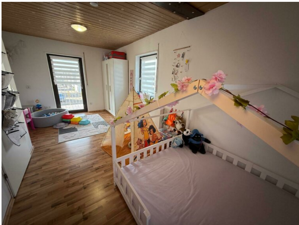
Kinderzimmer Nr. 1