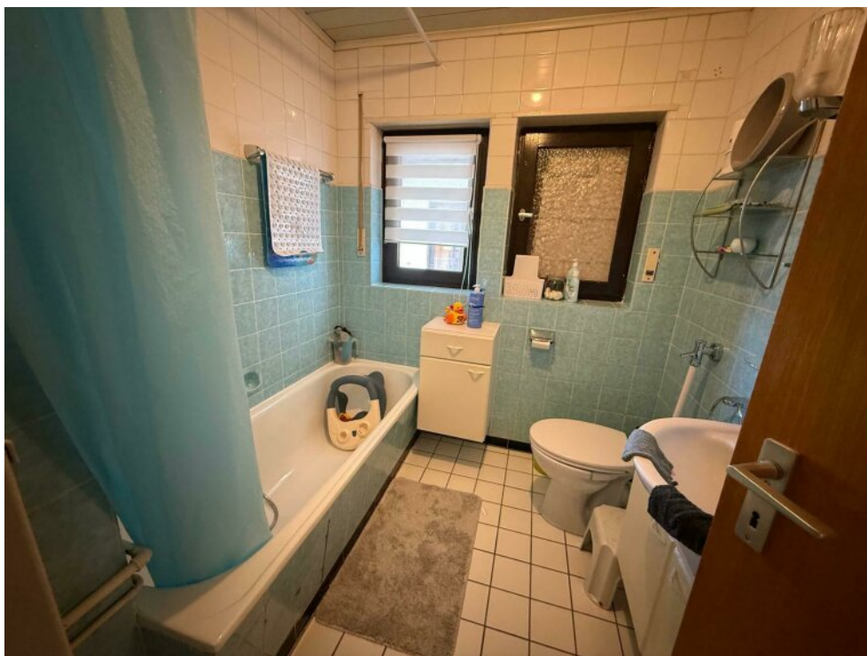
Kinderbad mit Wanne