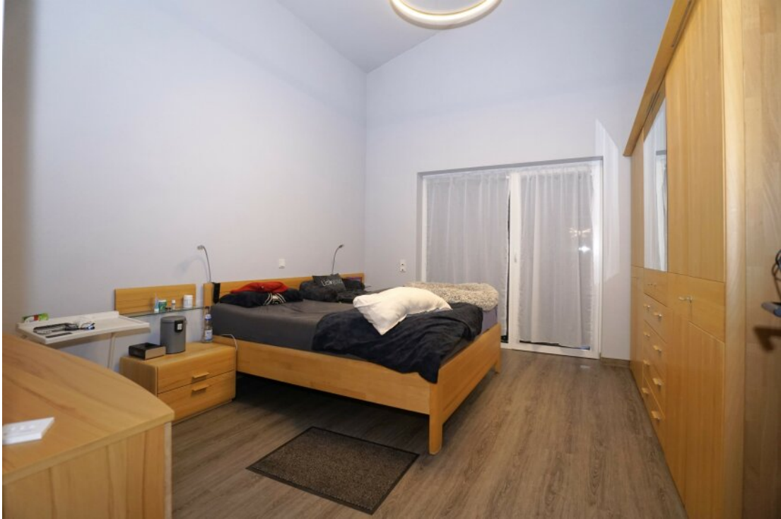
Schlafzimmer mit Terrassenzugang