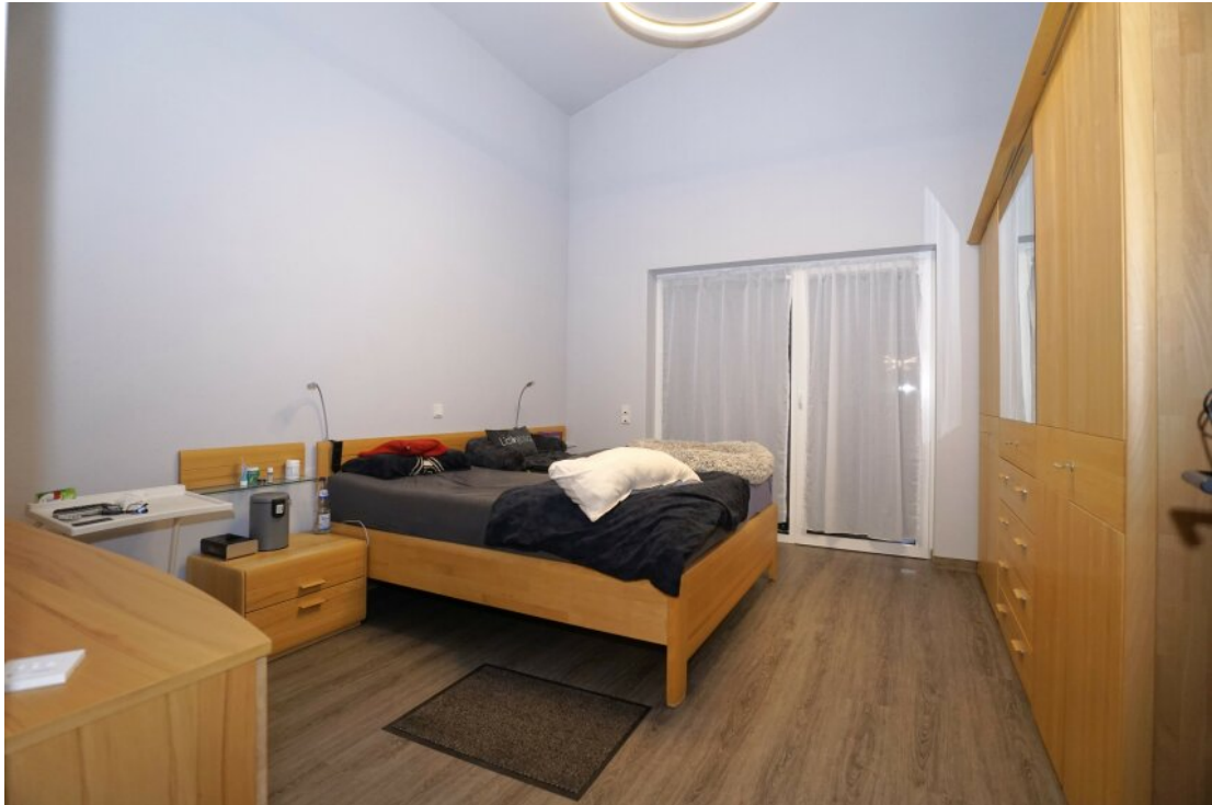
Schlafzimmer mit Terrassenzugang