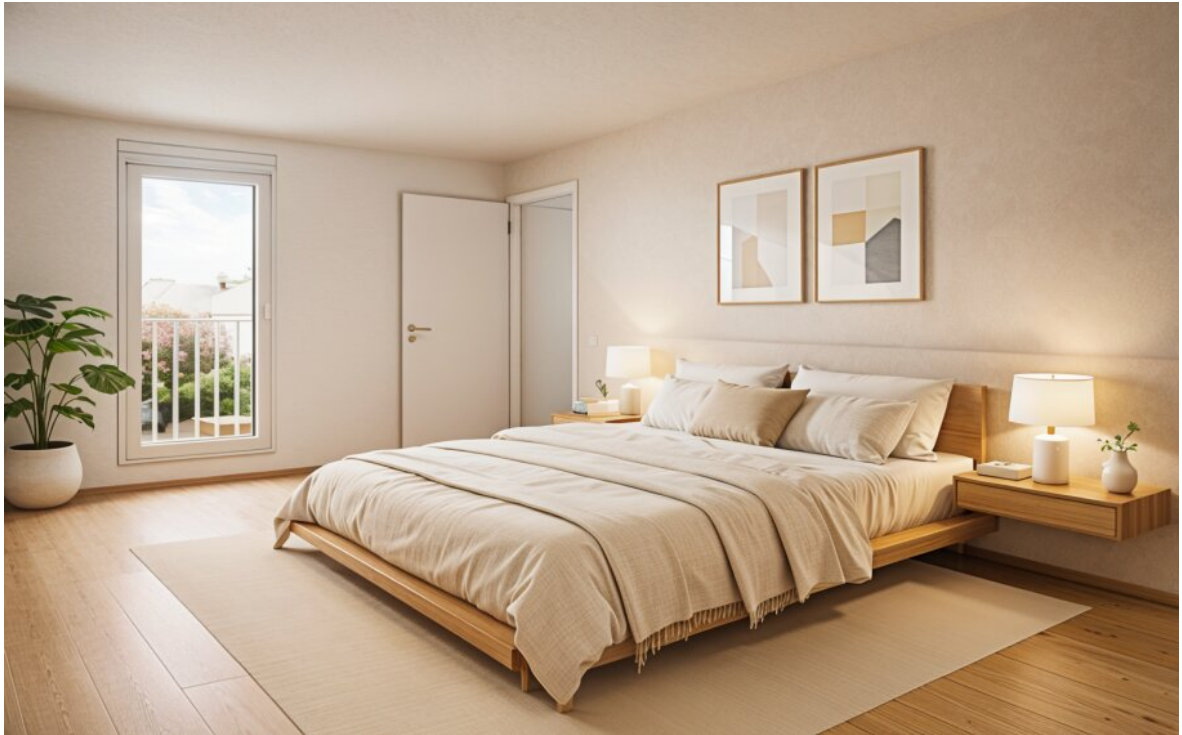
WE 9 Schlafzimmer