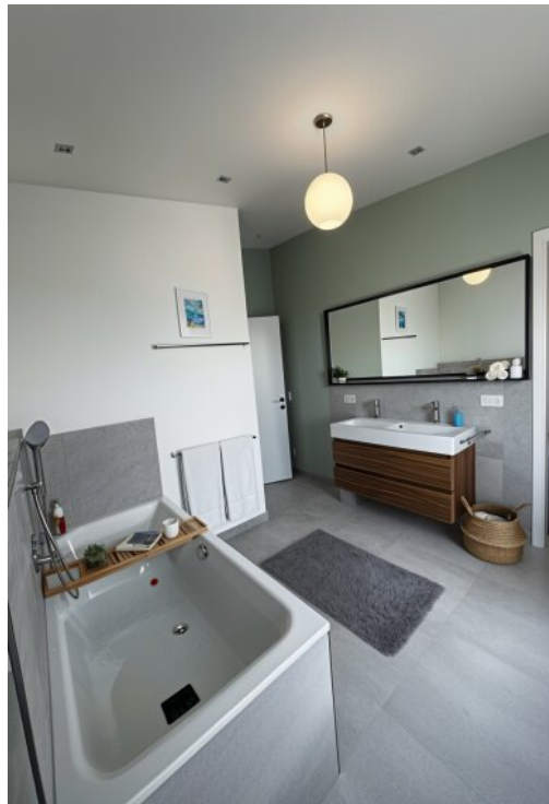
WE 9 Bad