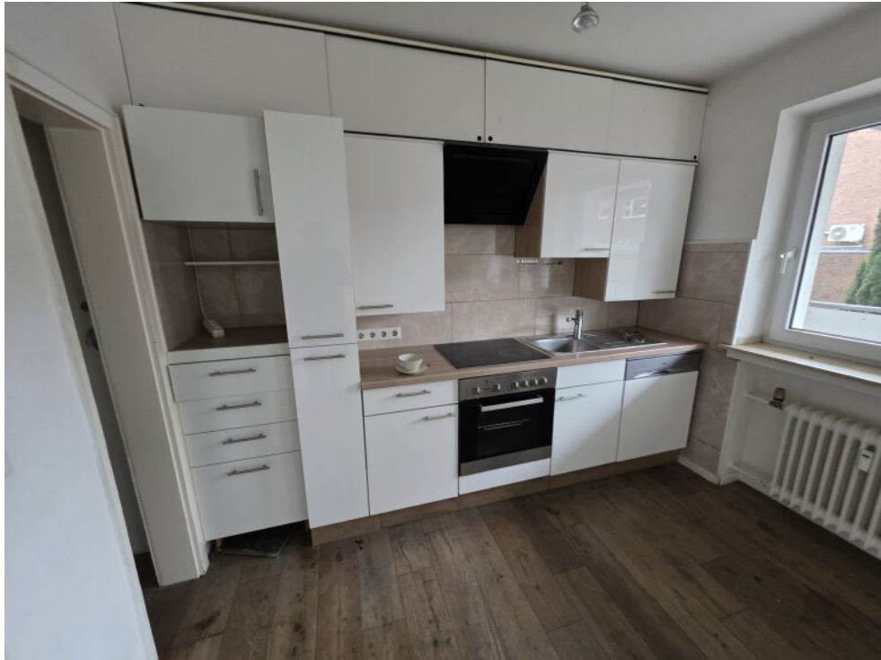
Küche von 2016