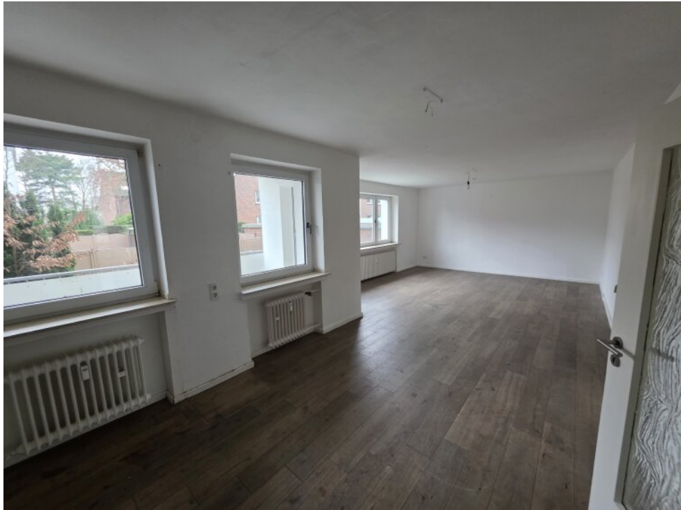
Wohnzimmer mit Laminat 2016