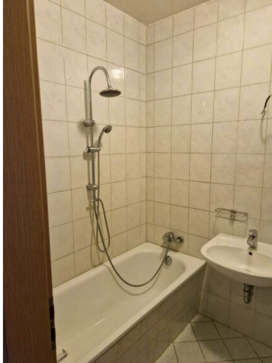
Bad mit Wanne/Dusche