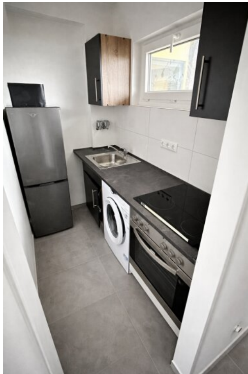
neue Einbauküche mit E-Geräten