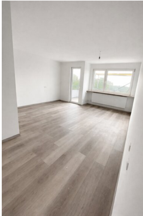
heller Lebensraum mit Balkon