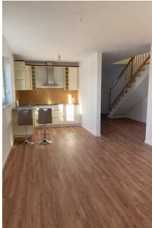
Wohnung 3 - Küche