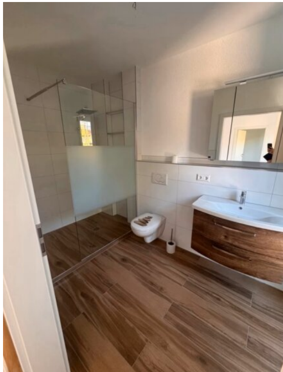
Wohnung 1 - Gäste-WC