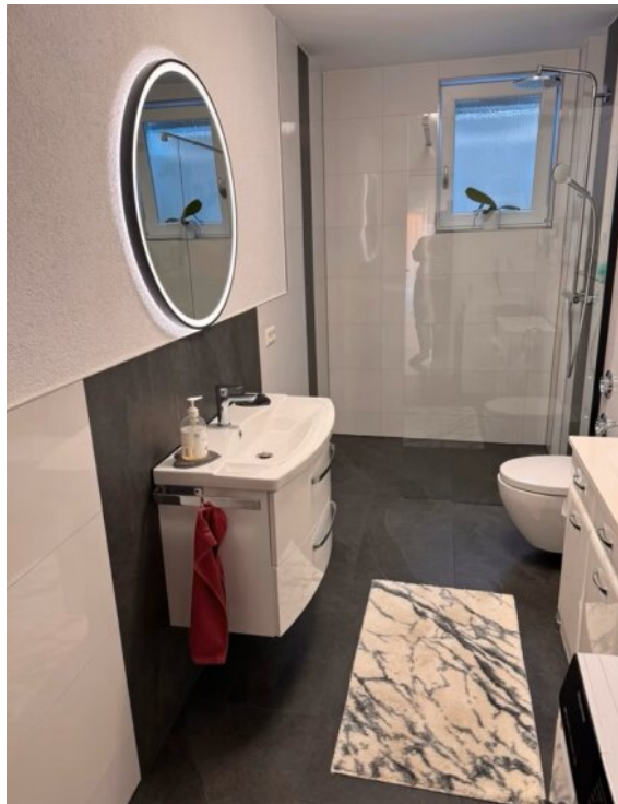
Wohnung 2 - Bad