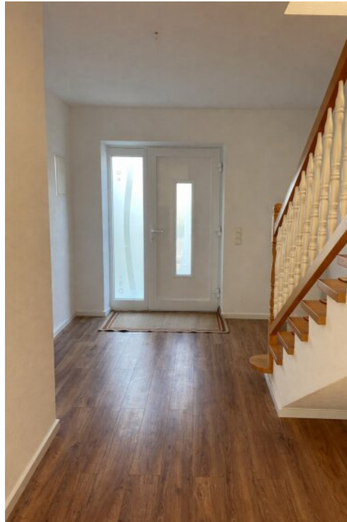
Wohnung 3 - Eingangsbereich