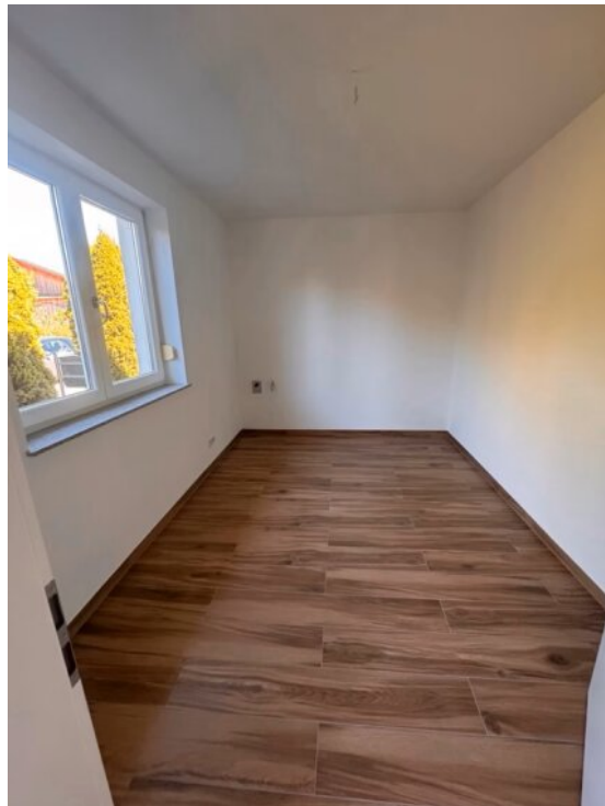
Wohnung 1 - Hauswirtschaftsraum