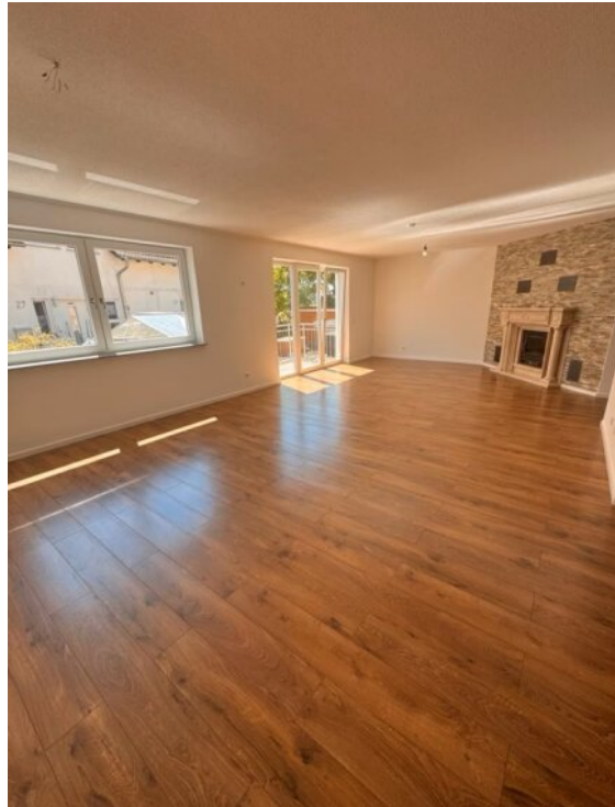
Wohnung 1 - Wohnzimmer