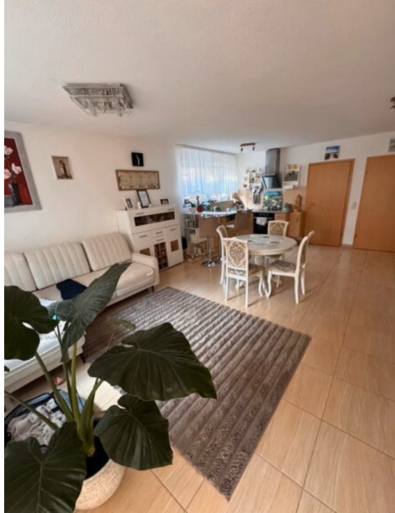
Wohnung 2 - Wohnzimmer