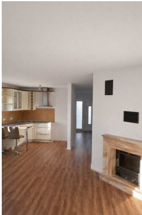
Wohnung 3 - Wohn-und Esszimmer