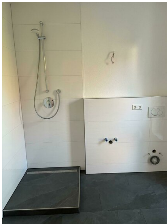
Wohnung 3 - Badezimmer