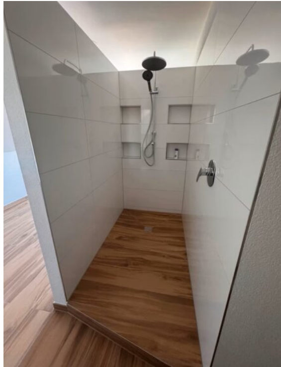
Wohnung 1 - Masterbad