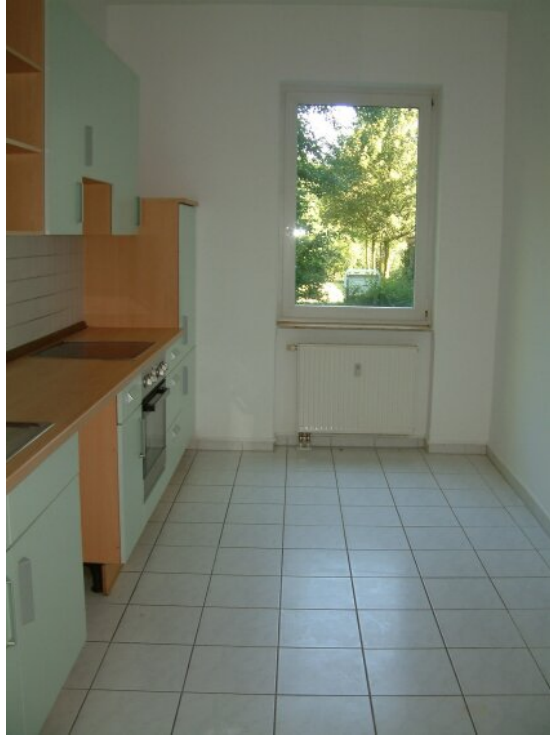
Küche Bild 1_2