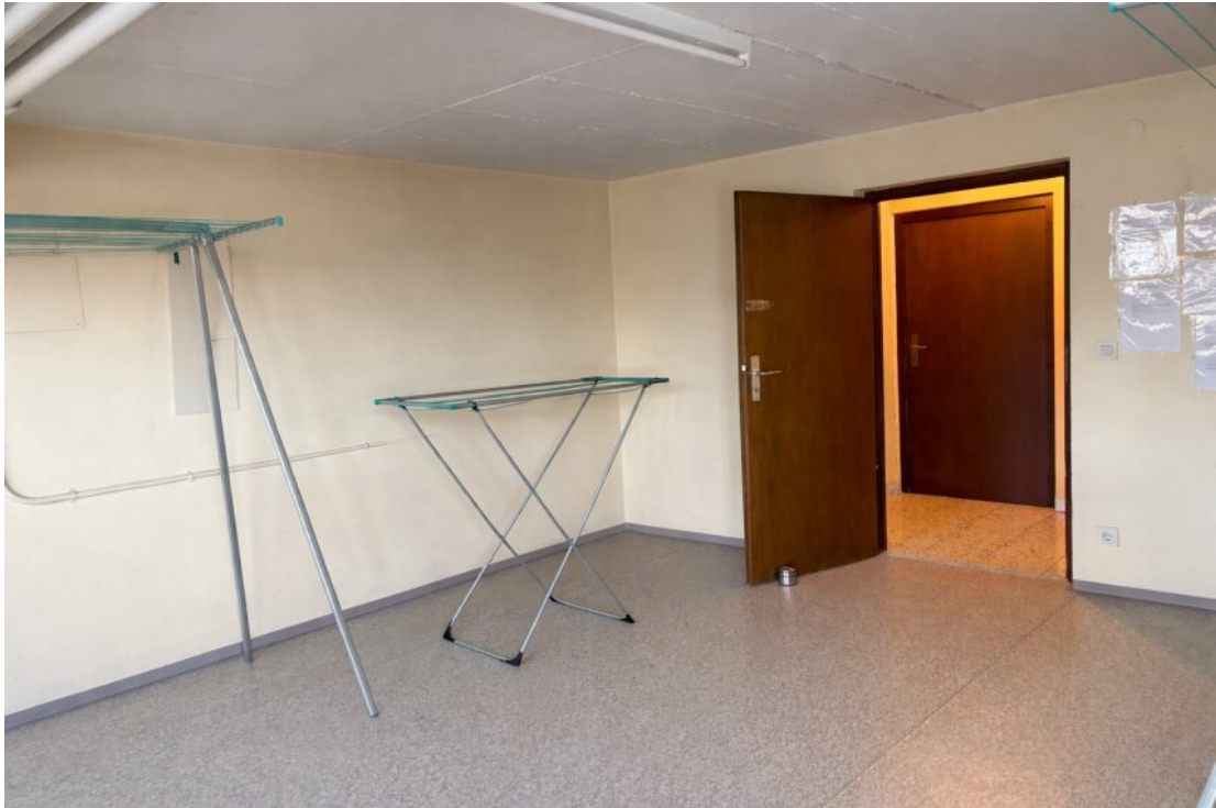
Wäschetrockenraum mit Zugang zum Garten