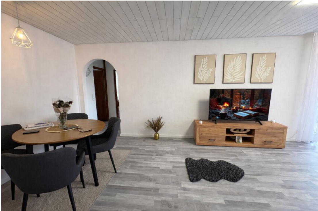
Esszimmer mit Durchgang zu den Schlafräumen