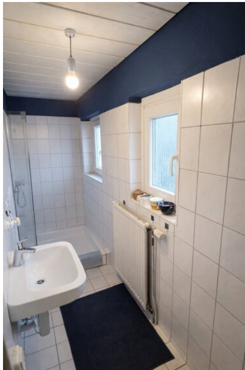
Bad im EG