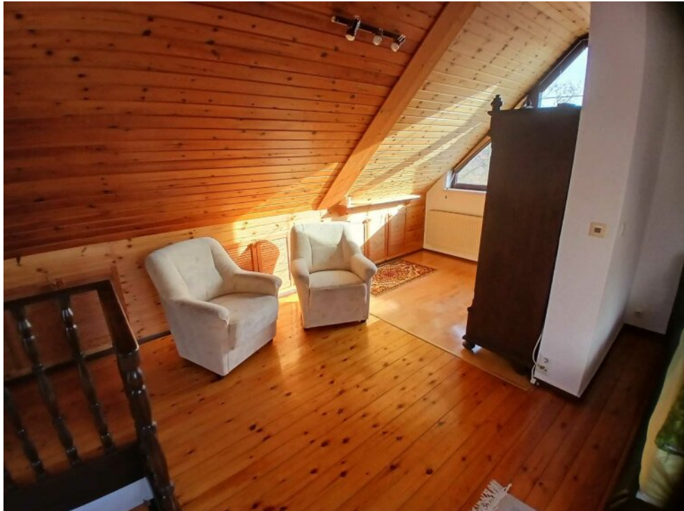
Schlafbereich 1. OG