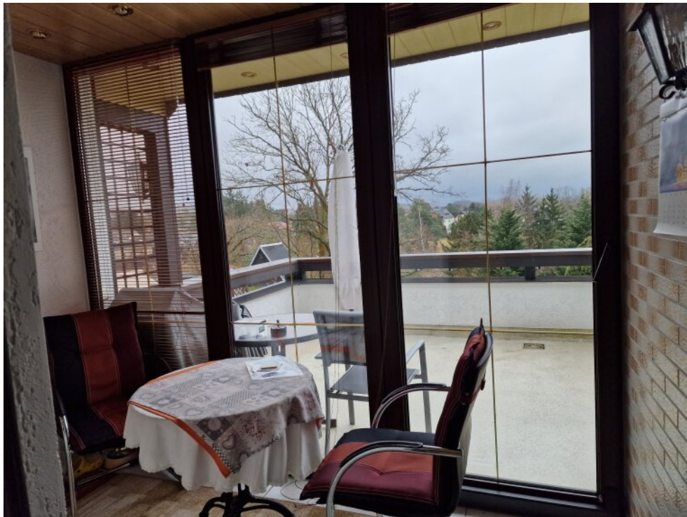
Vorbau + Terrasse