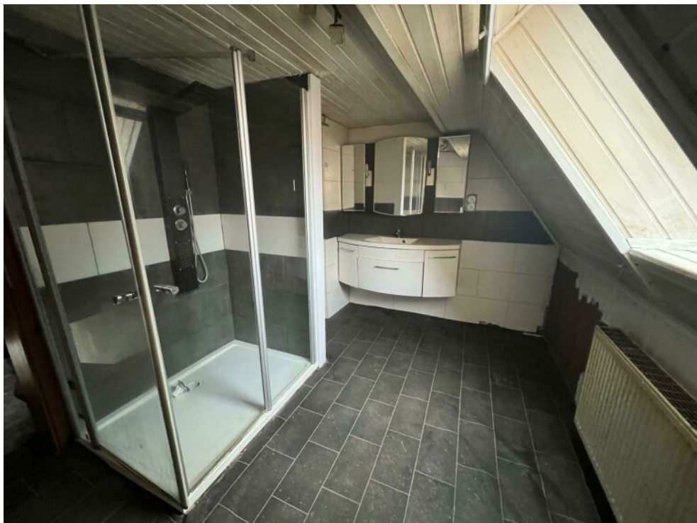
OG - Bad