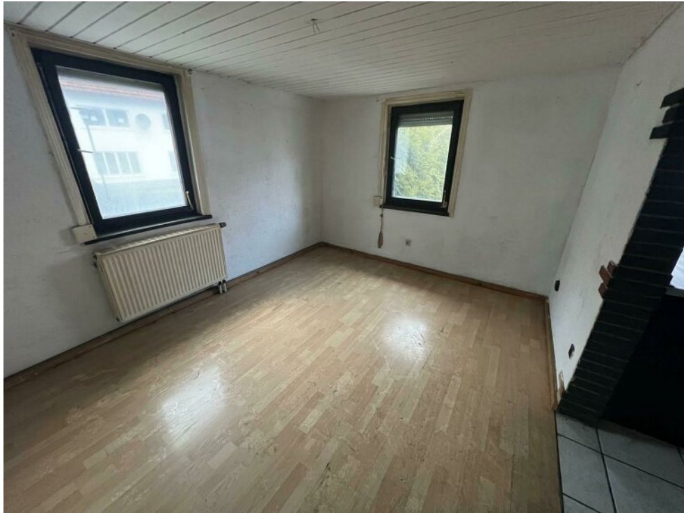
EG - Esszimmer