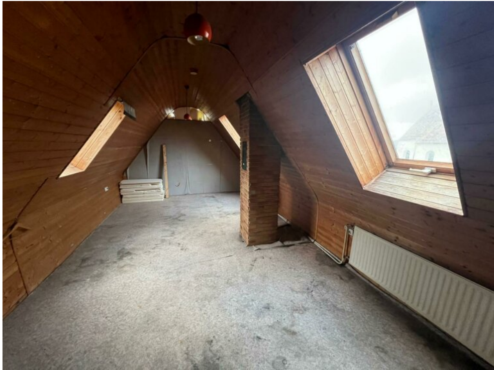
DG - Kind