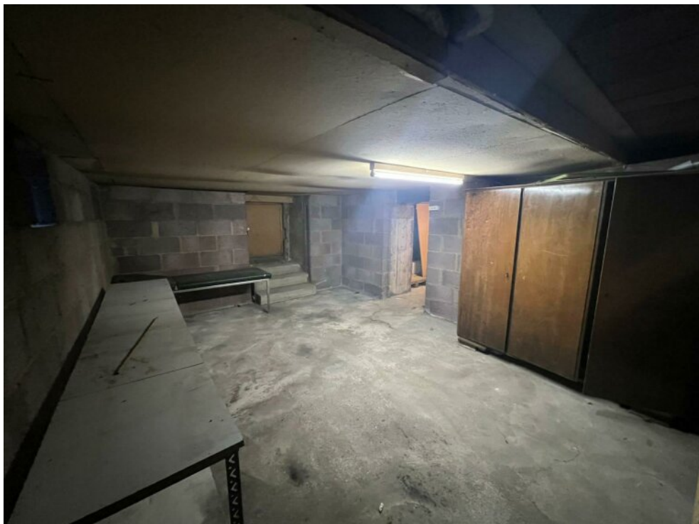
UG - Keller