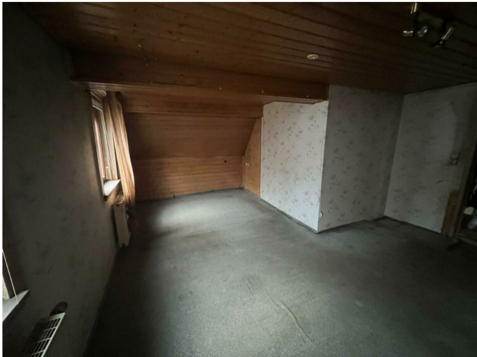
OG - Schlafzimmer