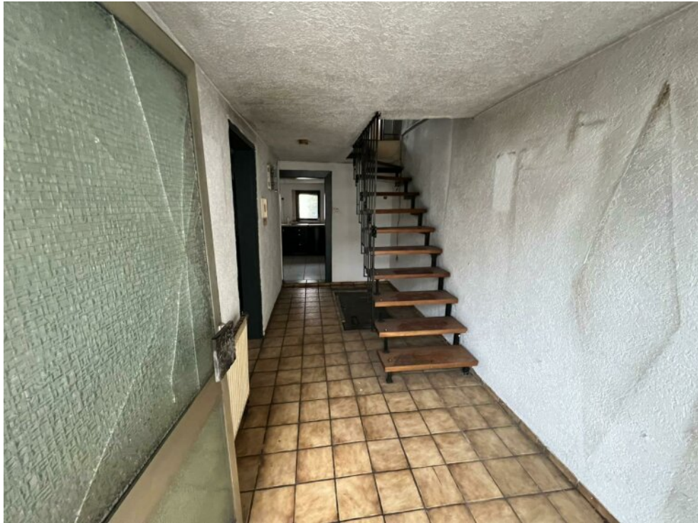
EG - Eingangsbereich