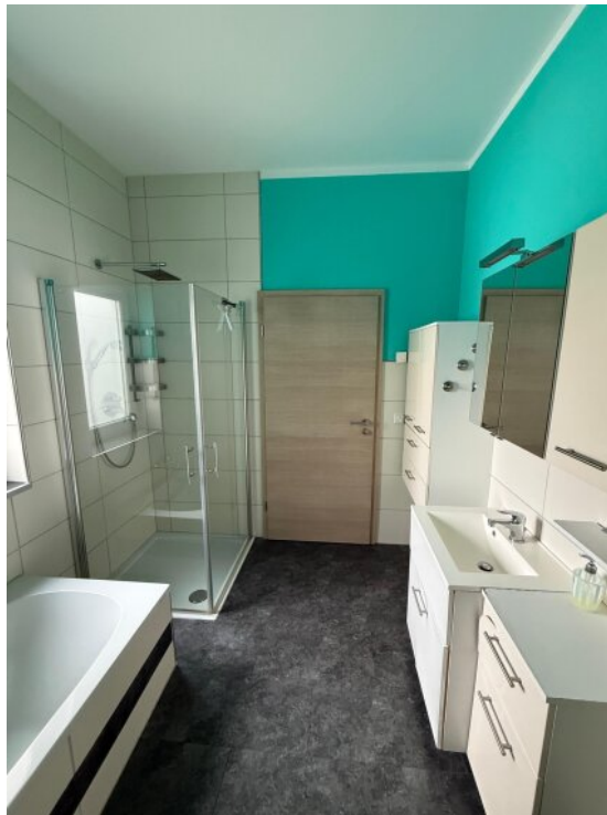
Tageslicht Bad Dusche