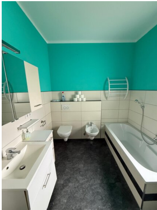
Tageslicht Bad mit Wanne