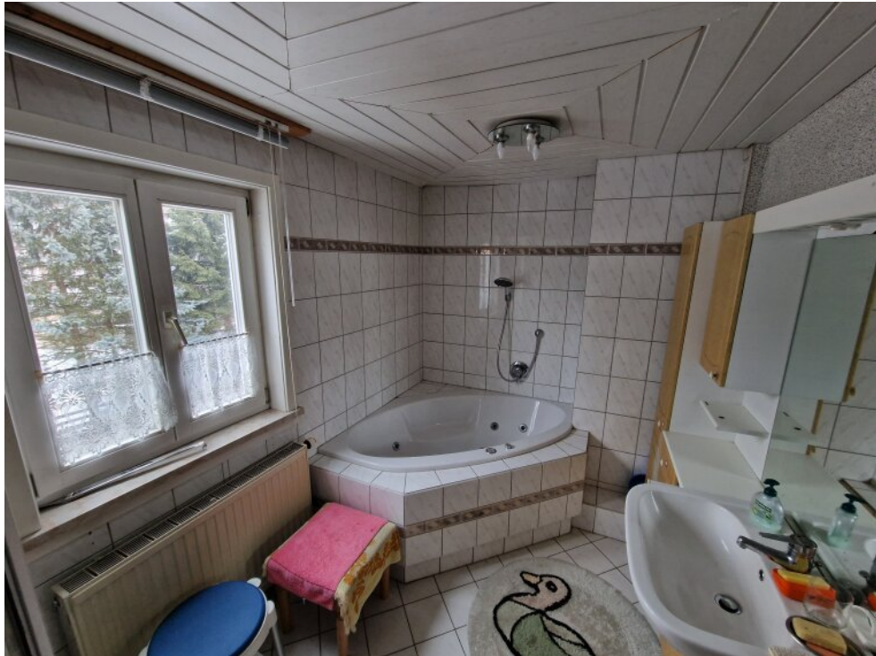
Bad mit Eckwanne