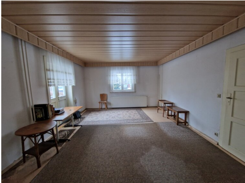
ehemaliges Wartezimmer EG