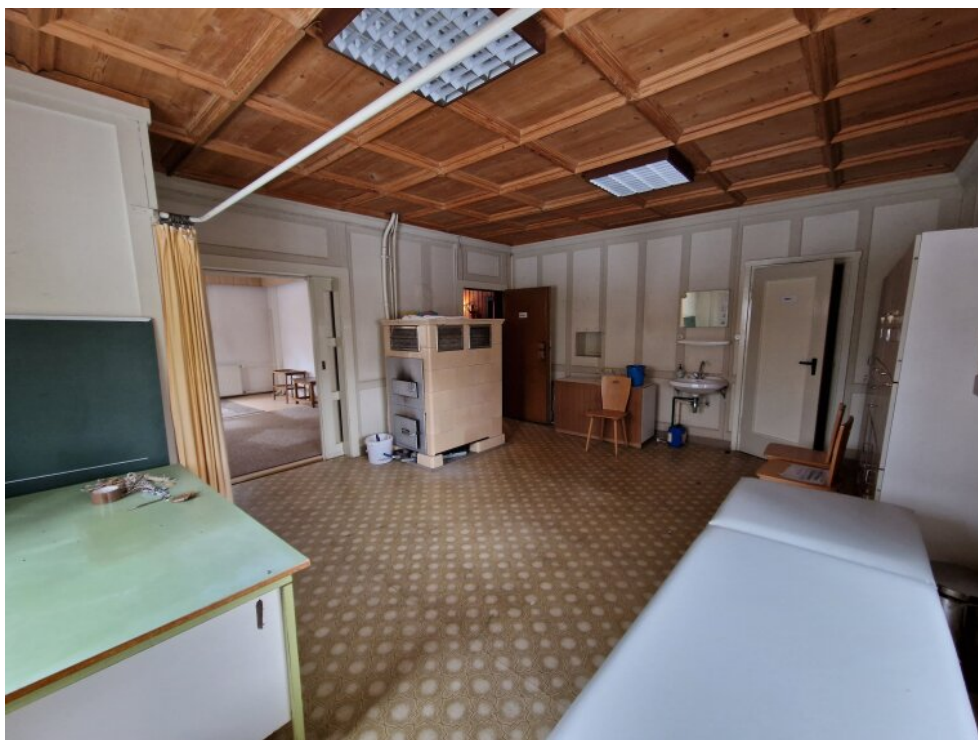
ehemaliges Behandlungszimmer 1