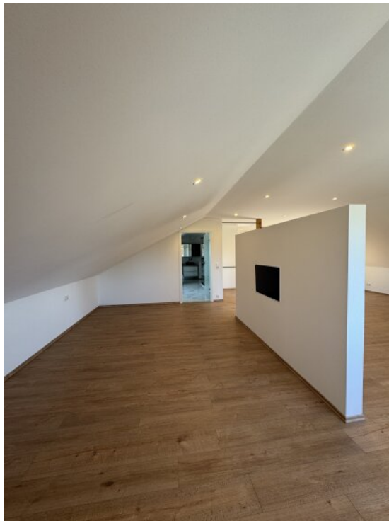
Loft - Wohnbereich