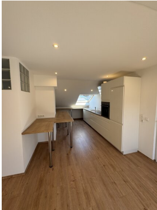
Loft - Küche