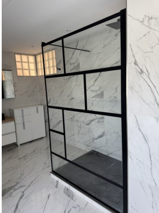
Loft - Badezimmer