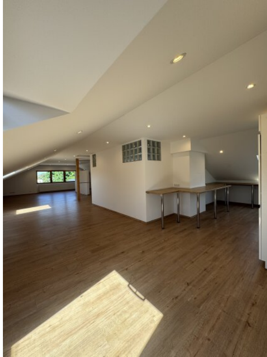
Loft - Wohnbereich