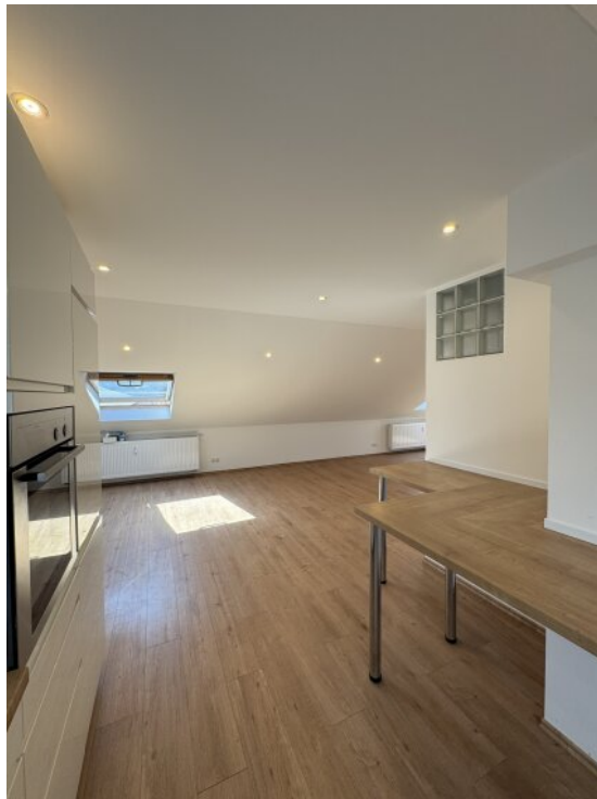
Loft - Küche