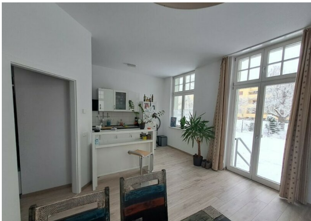
Wohnzimmer mit offener Küche