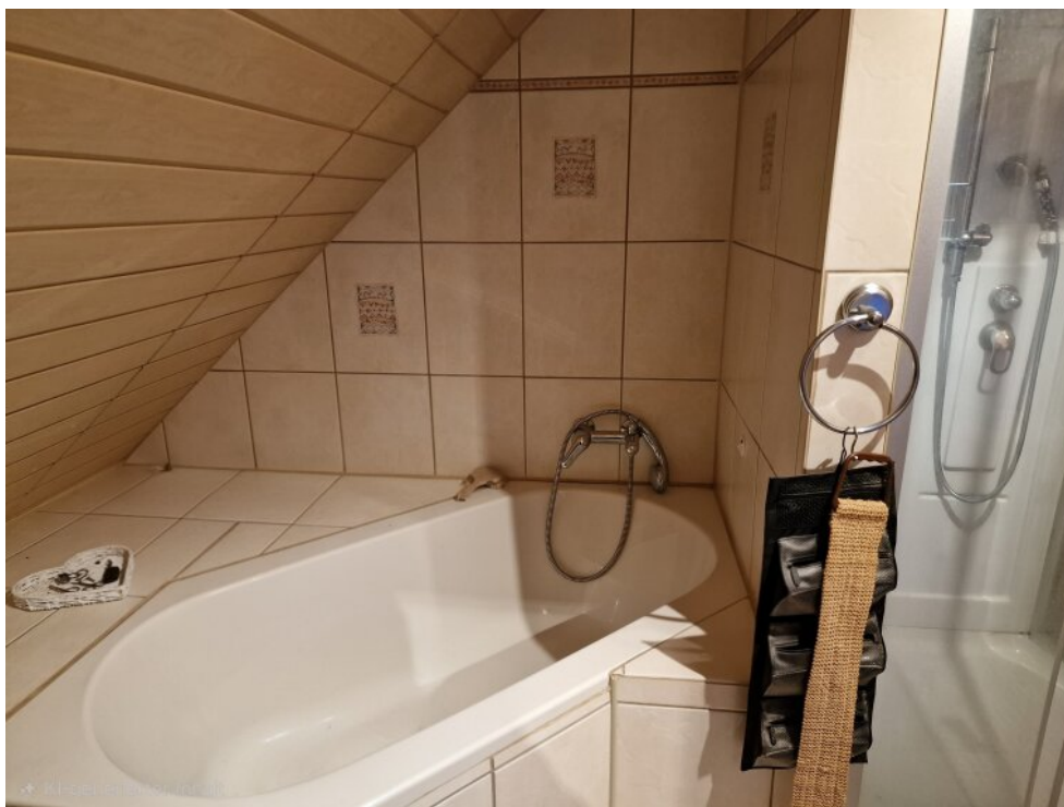
Bad mit Eckwanne 1. OG