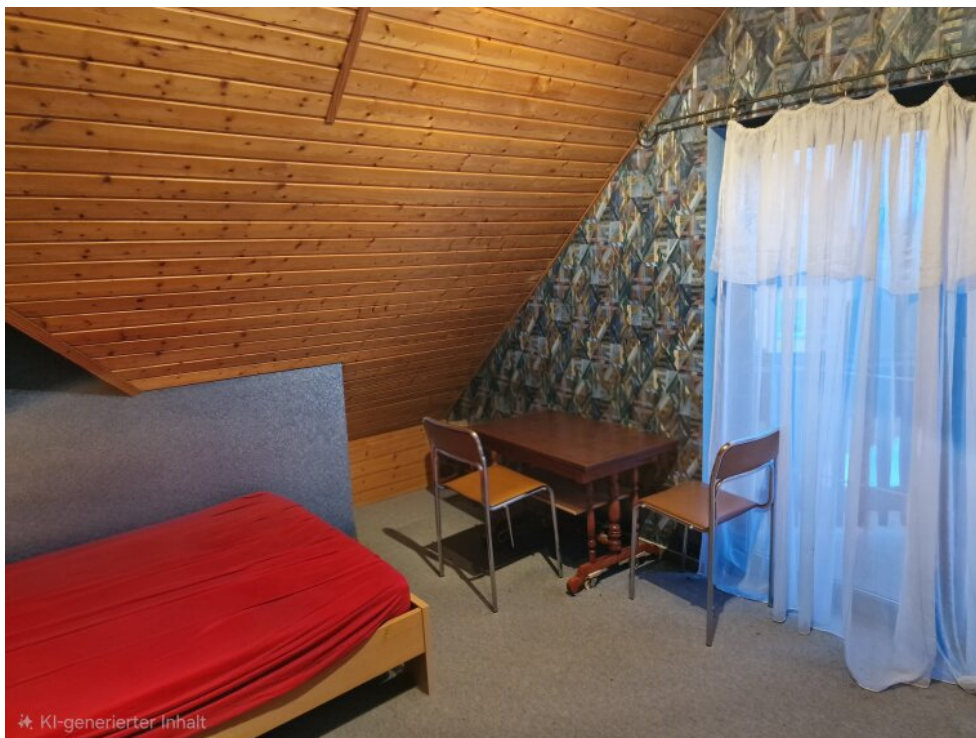
Kinderzimmer 2 mit Balkon