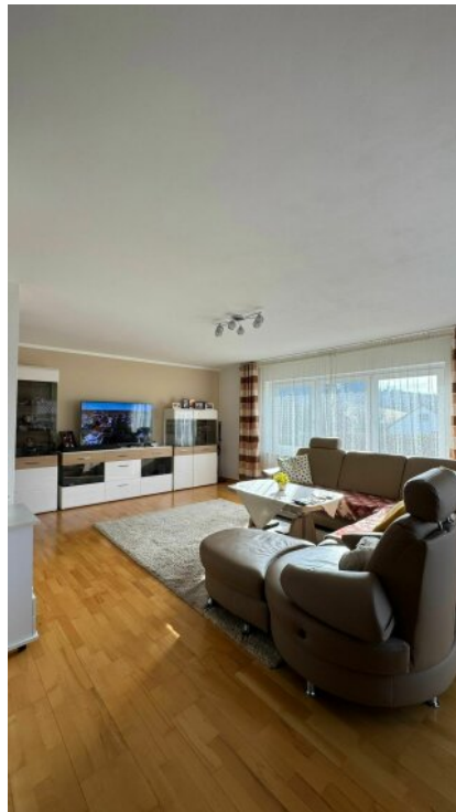
WhatsApp Image 2026-01-31 at 14.50.10 (5)