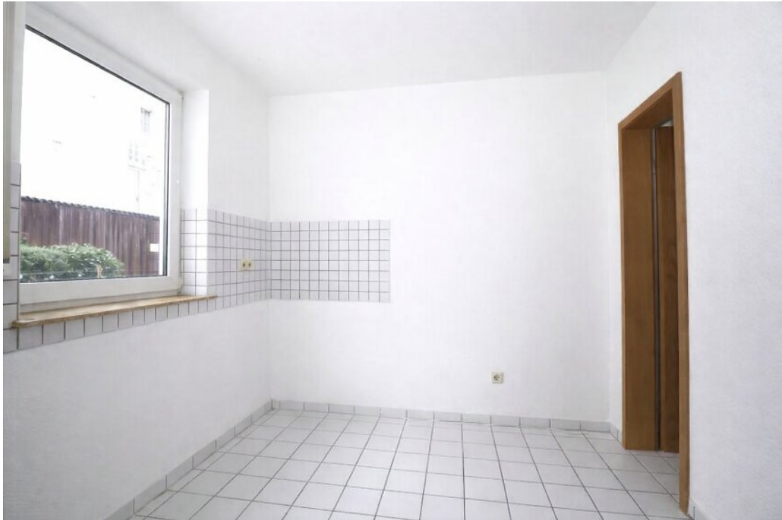
Küche mit Vorratsraum