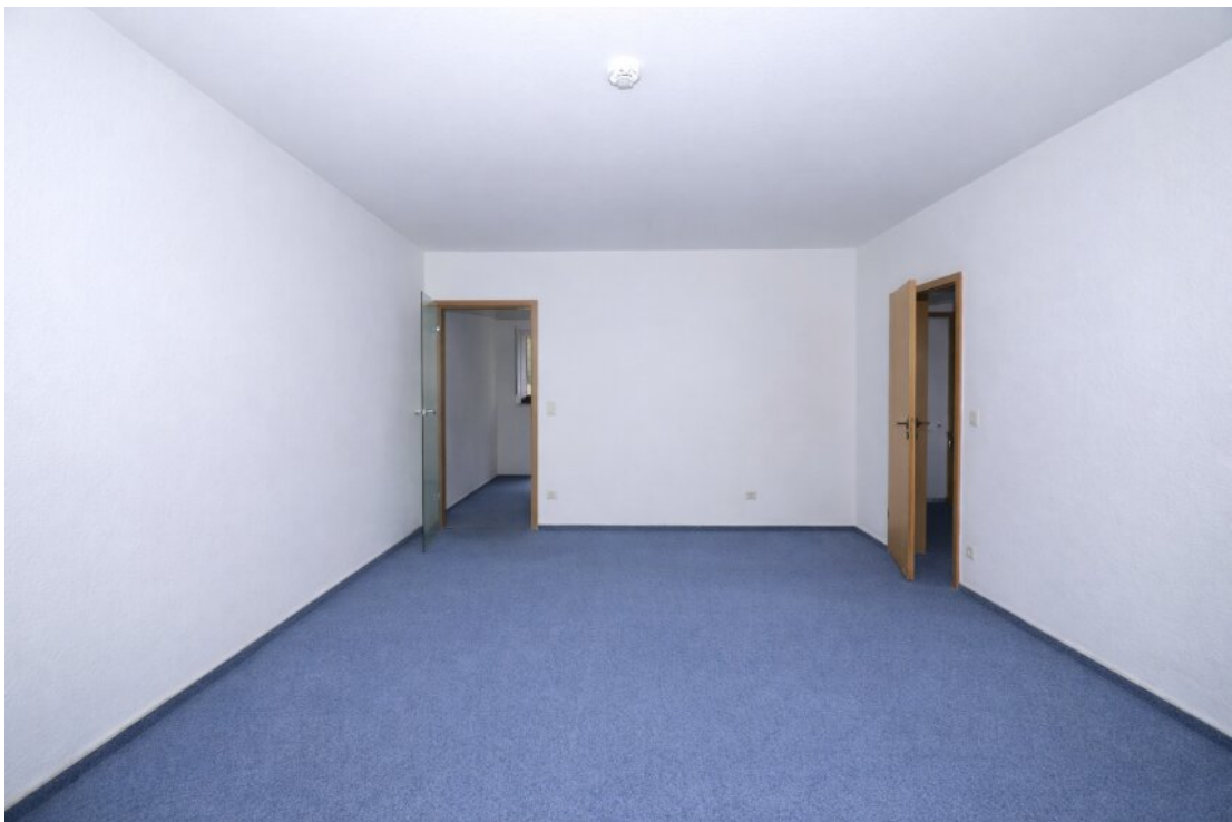
Ess-Wohnzimmer mit Balkonzug