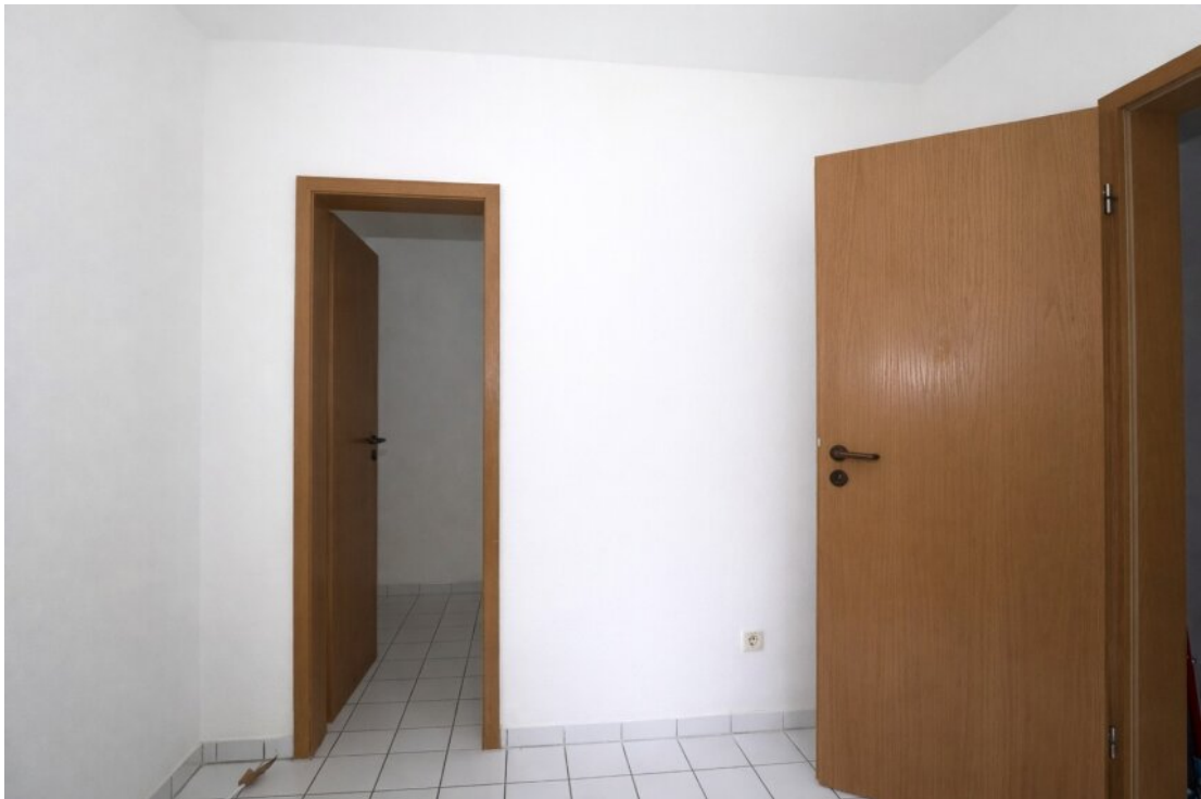
Küche mit Vorratsraum