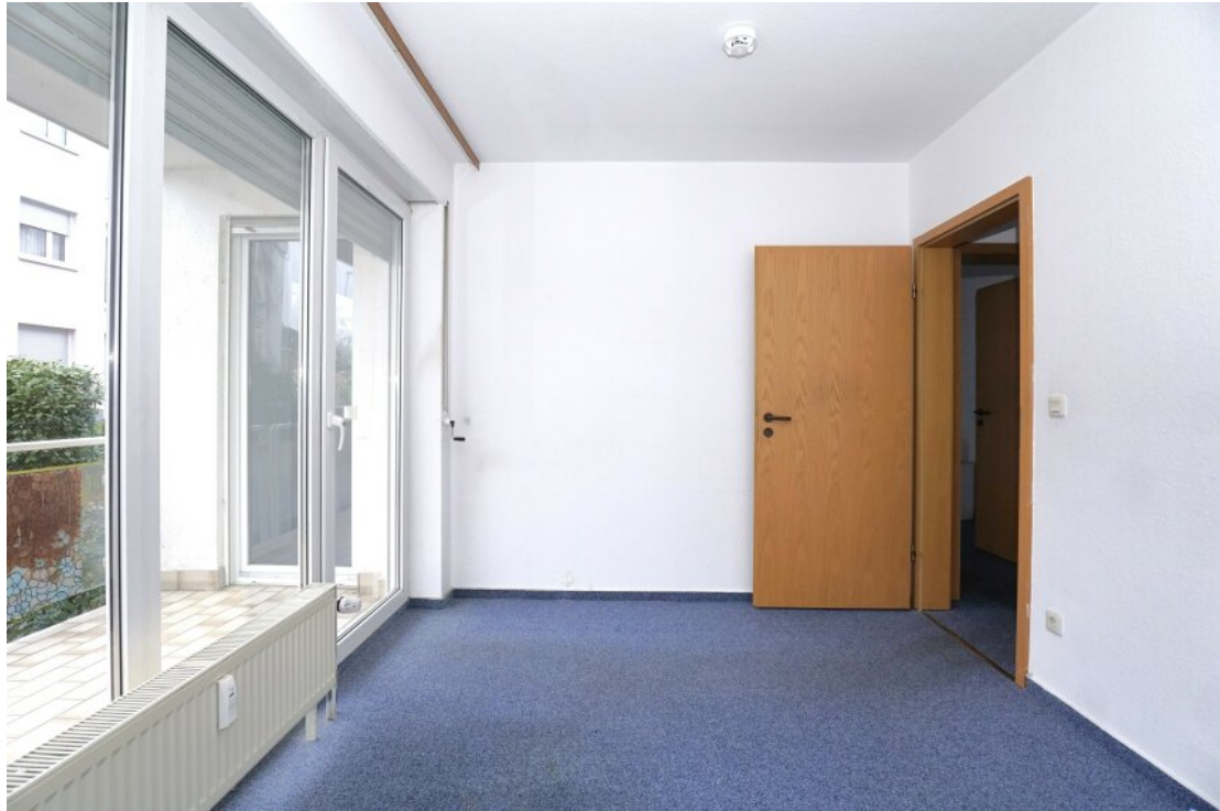
Schlafzimmer mit Balkonzugang