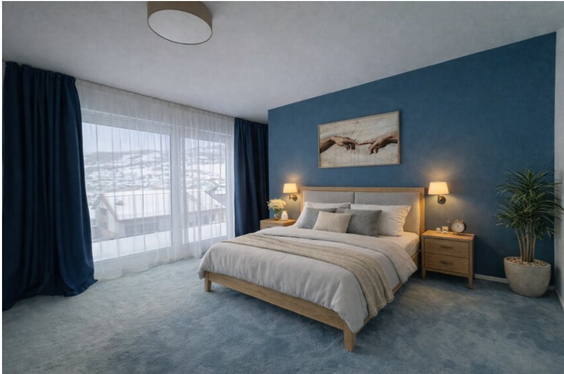
Schlafzimmer mit Ankleide