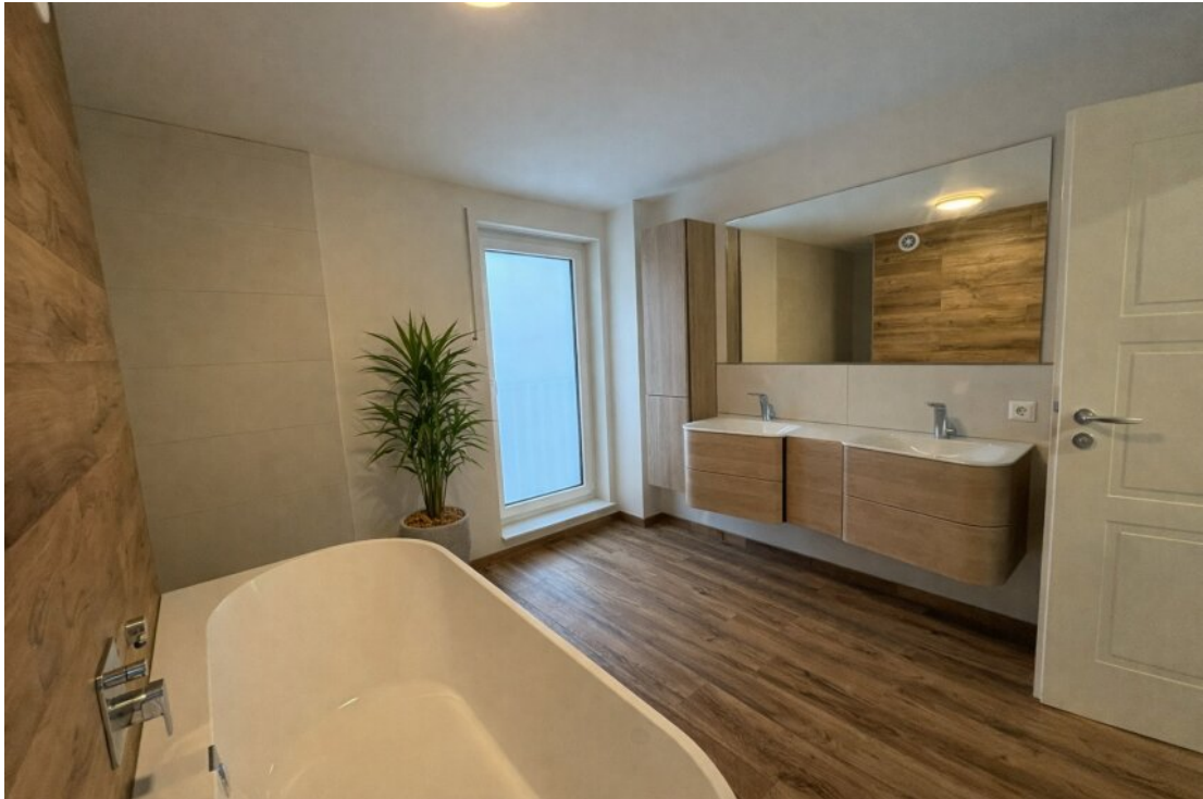
Exclusives Badezimmer mit begehbare Dusche