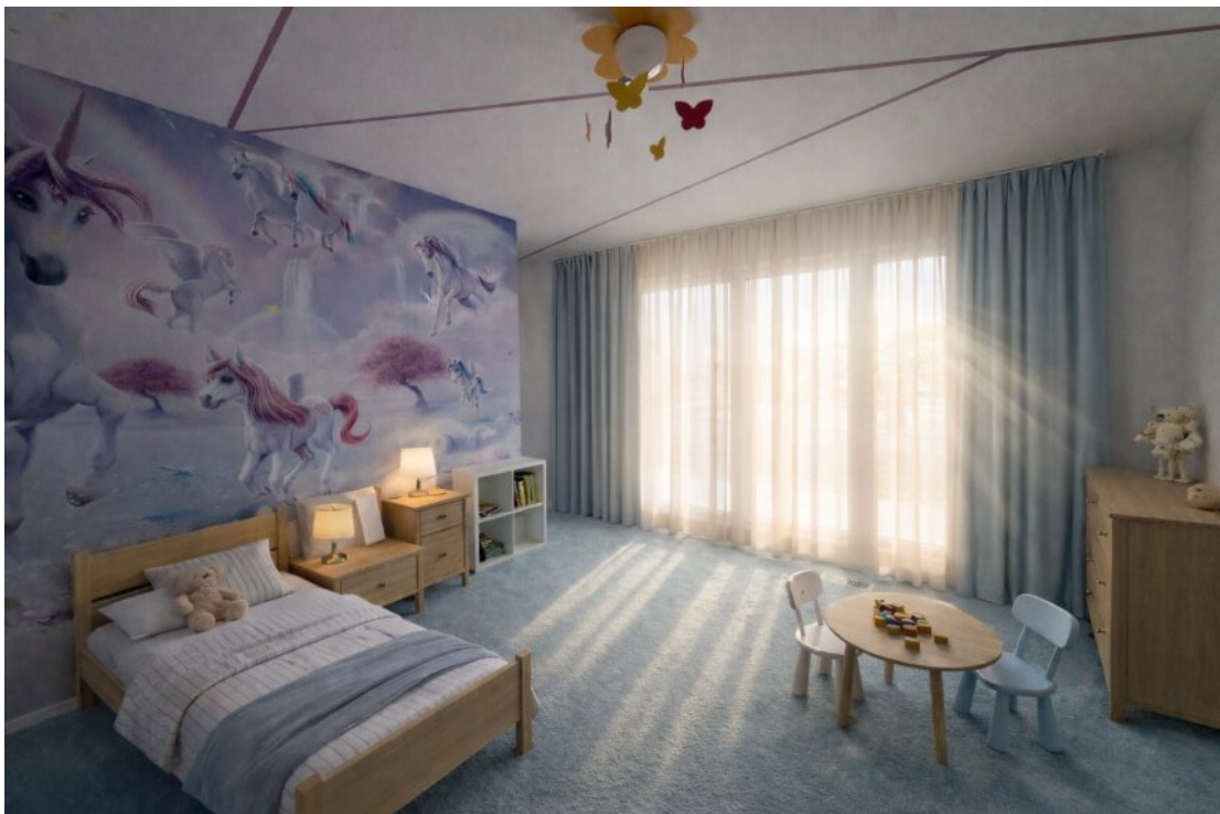
Kinderzimmer mit Ankleide