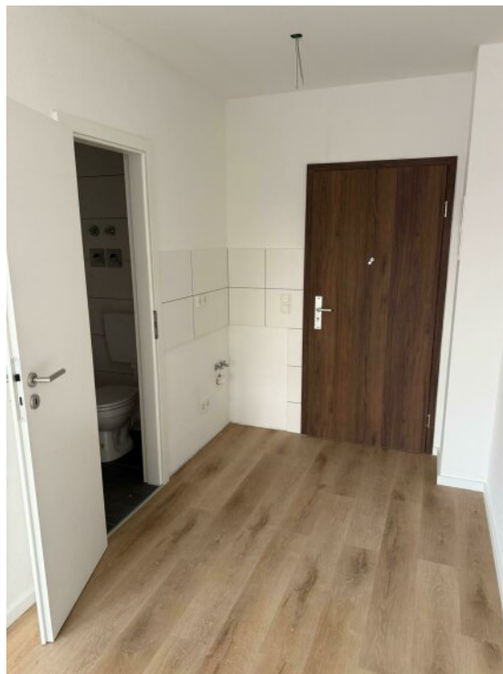
Anschlüsse für Küche