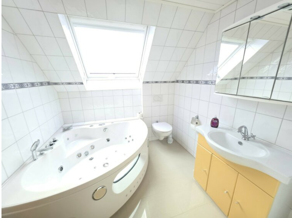
Badezimmer 1.OG Whirlpool