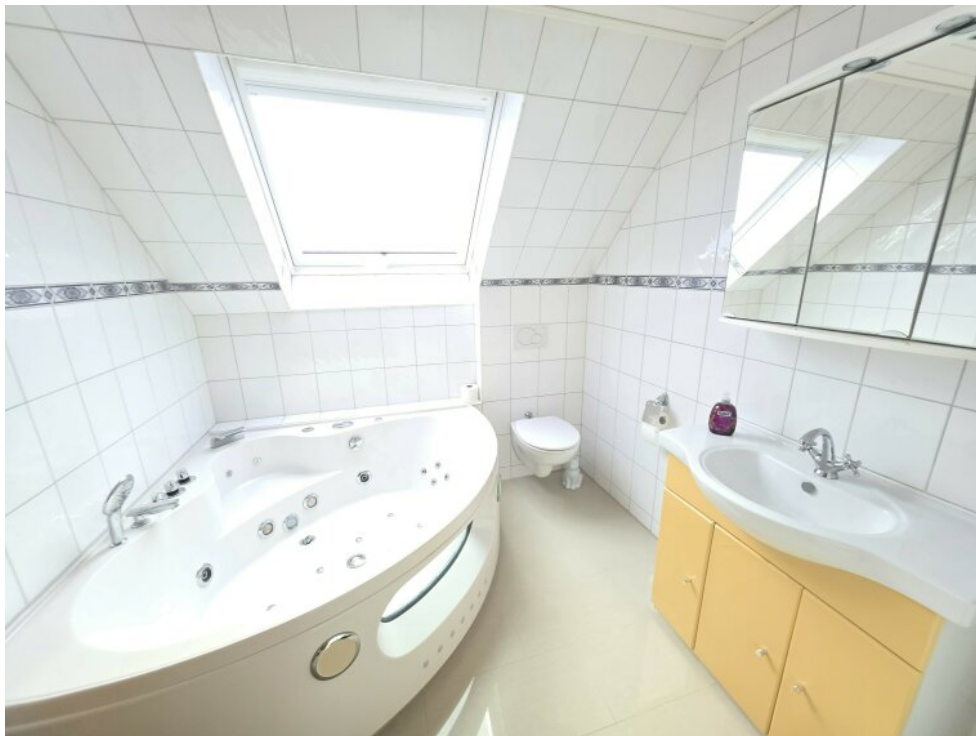
Badezimmer 1.OG Whirlpool