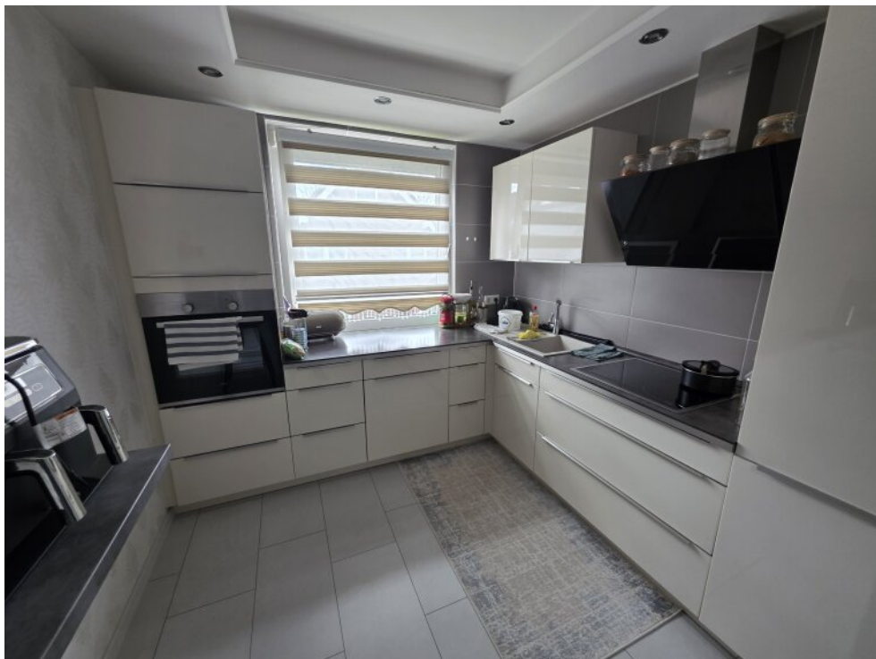
hochwertige Küche MFH