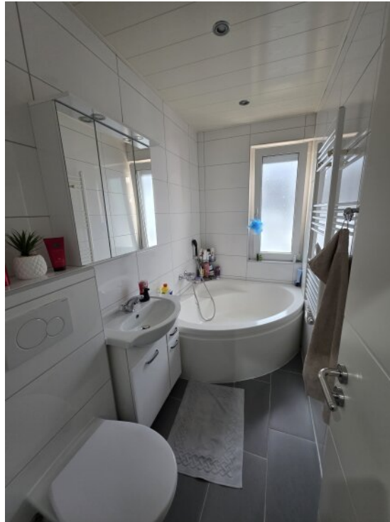
Badezimmer mit Wanne MFH